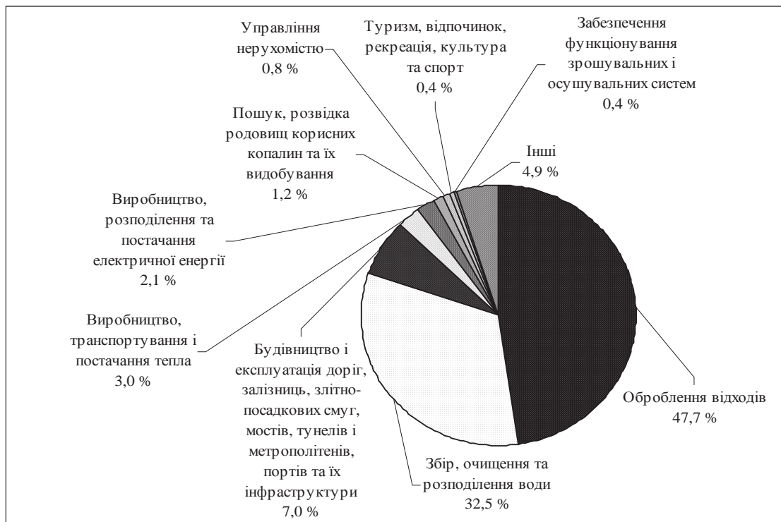
Рис. 1. Розподіл проектів ППП за сферами господарської діяльності в Україні, 2013 р., %

показниками якості доріг (144 місце за рейтингом серед 148 країн), аеропортів (105) та морських портів (94) [10, с. 377]. У зв'язку з тим, що значна частка суспільнозначимих проектів є ризиковими, високовартісними, з прагненням держави перенести фінансове навантаження на бізнес, можна очікувати, що розвиток ринку ППП в країні буде доволі стриманим. В Індії — країні з високим рівнем розвитку ППП — при реалізації суспільнозначимих проектів співвідношення між публічним та приватним секторами складає 71: 29, в залізничній інфраструктурі — 83: 17, системі водопостачання та водовідведення — 97: 3 [3, с. 11], що обумовлено побоюванням уряду переносити значні фінансові витрати на бізнес, оскільки це означатиме автоматичне зростання вартості послуг для населення;