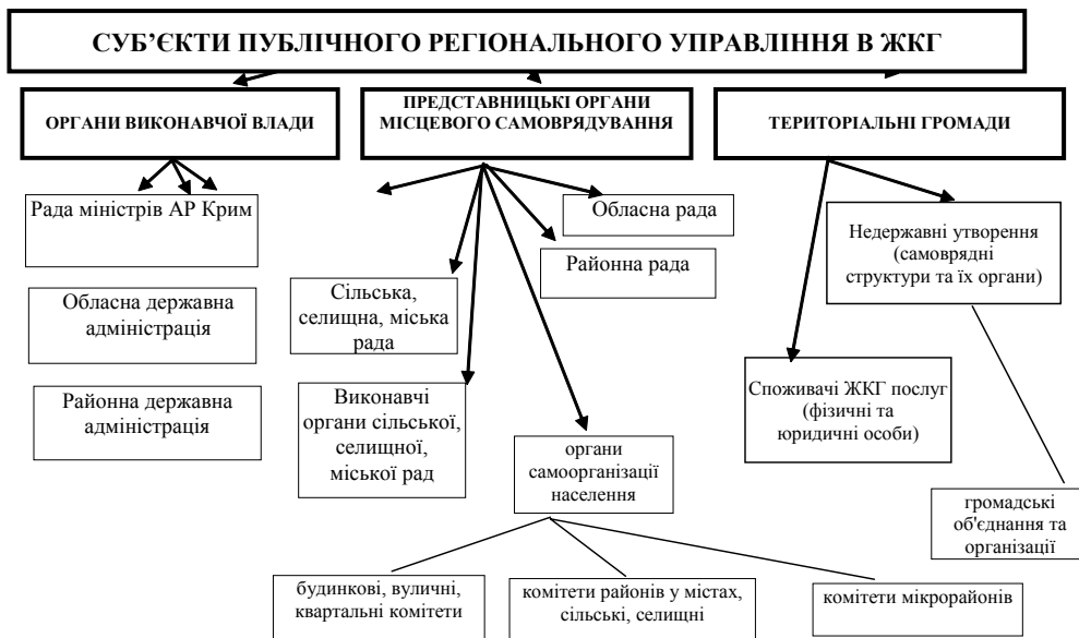
Рис. 2. Суб'єкти публічного регіонального управління в сфері ЖКГ

об'єднання громадян об'єднують споживачів житлово-комунальних послуг (фізичні та юридичні особи), недержавні утворення (самоврядні структури та їх органи), громадські об'єднання, організації.