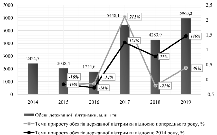
Рис. 2. Динаміка обсягу державної підтримки сільського господарства та темпи її приросту протягом 2014—2019 рр.

Так, у 2019 р. Законом України "Про Державний бюджет на 2019 рік" (зі змінами) Міністерству аграрної політики та продовольства передбачені видатки в обсязі 15 013,3 млн грн, з яких за програмами підтримки розвитку АПК — 5 963,3 млн грн (39,7% від загального обсягу). Загалом обсяг видатків Міністерства аграрної політики та продовольства України має тенденцію до збільшення, в той час як обсяг державної підтримки розвитку АПК має нестабільний характер (рис. 2).