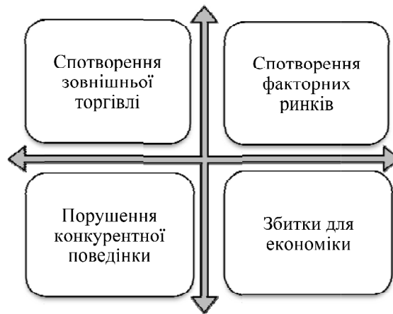
Рис. 3. Наслідки надання субсидій сільськогосподарським виробникам