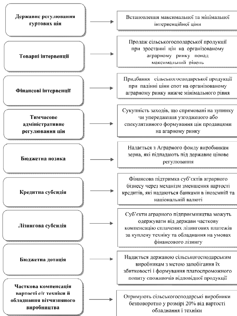
Рис. 1. Форми державної підтримки суб'єктів аграрного сектору

ходжень. Більше того, аграрний сектор відіграє провідну роль не лише у вітчизняній економіці. Так, Україна є одним із лідерів із виробництва та експорту багатьох видів сільськогосподарської та харчової продукції у світі (частка експорту у 2019 р. складала 40%). Як наслідок, зростання аграрного сектору є запорукою розвитку економіки України, формування позитивного зовнішньоторговельного балансу та стабілізації валютного ринку. Більшість відомих вітчизняних і зарубіжних вчених вважають, що ефективного та стабільного розвитку сільського господарства можна досягнути завдяки належному фінансуванню потреб його відтворення. З урахуванням цього, чинні методи державної підтримки аграрного сектору потребують удосконалення, адже надання дотацій та компенсацій не відповідає сучасним вимогам і не впливає на розвиток сільського господарства, підвищення ефективності господарювання, створення умов для інноваційної якості відтворення в АПК.