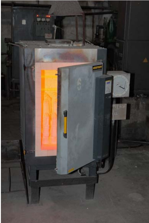
Прокалочные печи для термообработки литейных форм фирмы

– уменьшения теплопотерь от наружных стенок печи в окружающую среду за счёт использования на печах N660 новых футеровочных материалов.