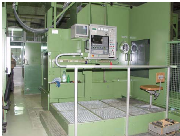
Рис. 2. Внешний вид станка Starrag

а) металлообрабатывающий центр (станок) «Starrag», обеспечивающий «лезвийную» обработку турбинных лопаток, вместо энергоёмкой электрохимической их обработки (рис. 2, 3). Снижение удельного потребления электроэнергии на обработку лопаток составило свыше 20 %.