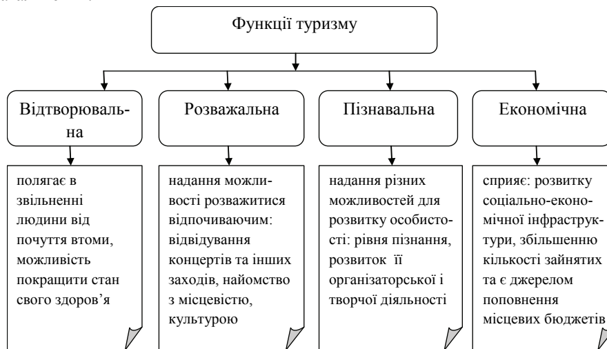
Рис. 1. Функції туризму

Туризм впливає на соціальний розвиток регіонів і країни в цілому, виконуючи ряд основних функцій (рис. 1).