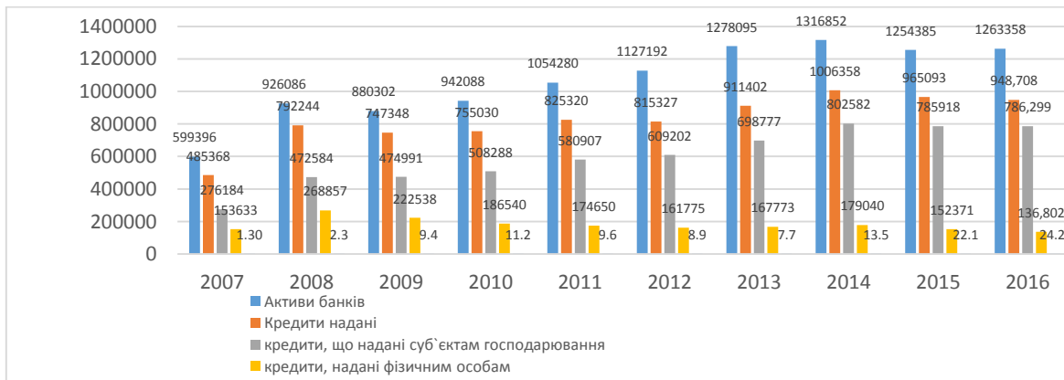
Рис. 2. Активи банків України 2007-2016 рр. (млн. грн)* * розраховано за даними НБУ станом на 01.12.2016 р [6]

Динаміка активів у 2015 р. визначена кількома вагомими факторами, серед яких ліквідація ряду проблемних банківських установ, відтік клієнтських коштів поряд із суттєвою девальвацією гривні. Станом на 1 грудня 2016 року сукупний обсяг активів БСУ становив 1263,36 млрд грн, незначно зросли на 3,03 %. Кредитна активність банків впродовж 2014-2016 рр. залишається низькою, що обумовлено скороченням ресурсної бази, погіршенням кредитоспроможності позичальників. Протягом даного періоду обсяг кредитного портфеля скоротився на 57650 млн. грн або на 5,72 % та станом на 1 грудня 2016 року склав 948 млрд. грн (див. рис. 2).