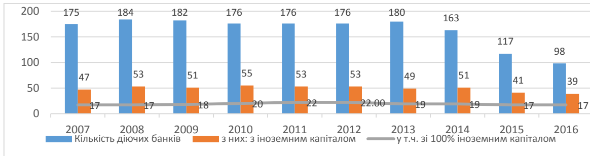
Рис. 1. Динаміка зміни кількості банків України 2007-2016 рр. (млн. грн)* * розраховано за даними НБУ станом на 01.12.2016 р [6]

Станом на 1 грудня 2016 року ліцензію НБУ мали 98 банківських установ ( в т.ч. 39 банк з іноземним капіталом). В цілому щодо 82 банків було прийнято рішення про ліквідацію. Щодо 10 банківських установ рішення про відкликання банківської ліцензії та ліквідацію було прийняте без попереднього запровадження тимчасової адміністрації (див. рис. 1)