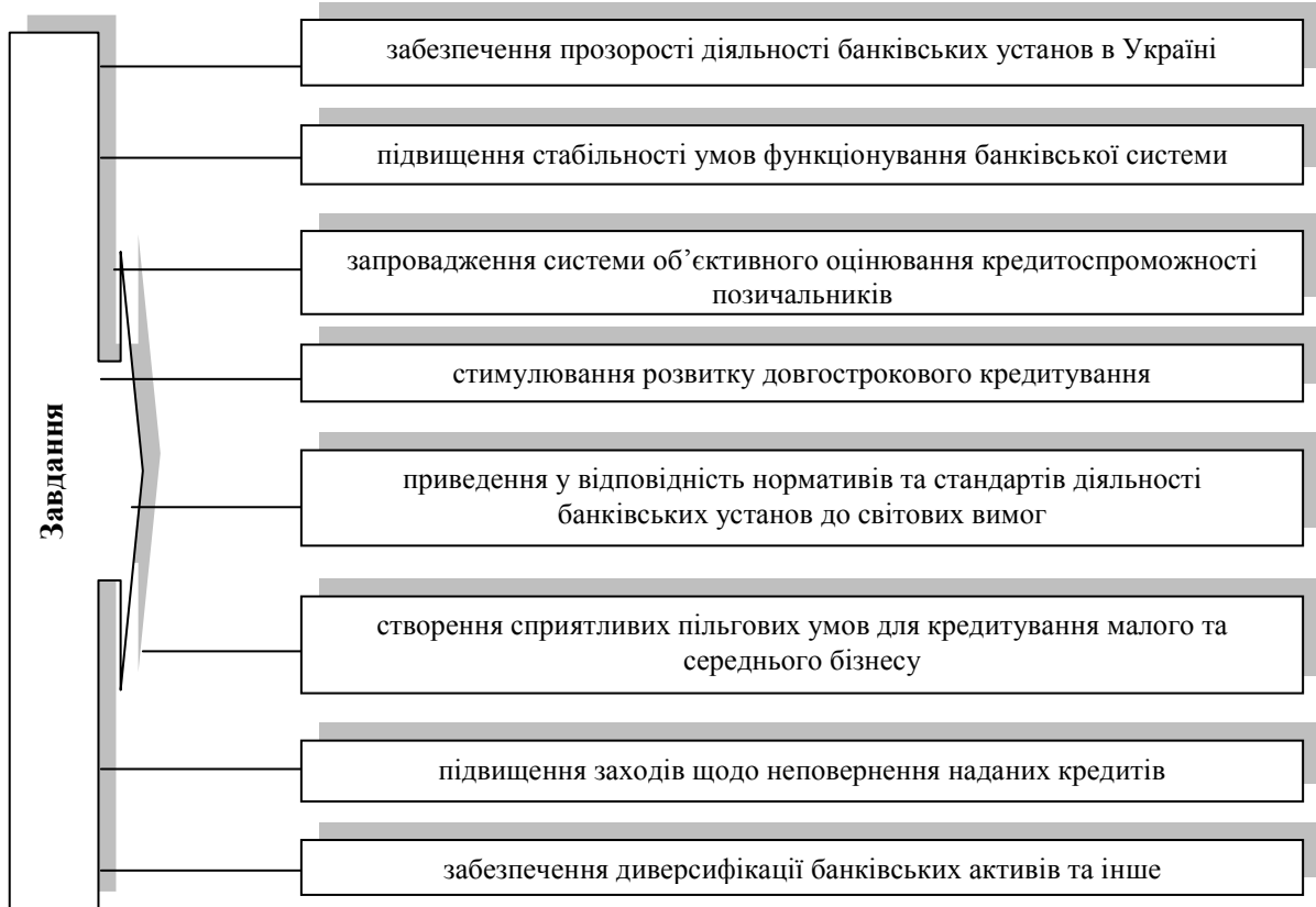
Рис. 3. Завдання підвищення ефективності кредитної діяльності банку

Вважаємо, що для підвищення ефективності кредитної діяльності потрібно виконати комплекс завдань (рис. 3).