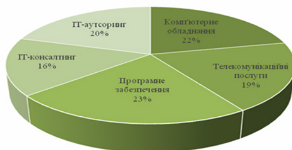
Рис. 3. ІТ-аутсорсинг у структурі ринку закупівлі ІТ-продукції та послуг державними і комерційними організаціями за категоріями, 2014 р. [7]

В даний час на ринку переважає придбання послуг ESP у вигляді разових замовлень і термінових проектів по впровадженню ІТ. У моделі класичного аутсорсингу (довгостроковий контракт з передачі частини бізнес-процесів) затребувані в основному послуги початкового рівня, такі як підтримка обладнання та ПЗ, управління корпоративними мережами і т. п. [2]