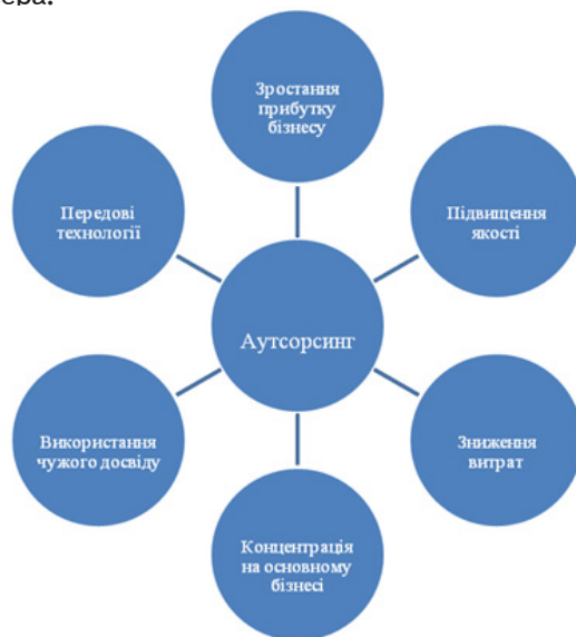
Рис. 1. Основні підстави використання аутсорсинга [1]

Слід зазначити, що аутсорсинг — продукт сучасних тенденцій розвитку світової економіки, протилежних тенденціям монополізації. Це методологія адаптації управління організацією до умов ринку, що дозволяє швидко входити в новий бізнес, використовуючи всі наявні можливості зовнішнього середовища, у тому числі в окремих випадках і ресурси конкурентів.