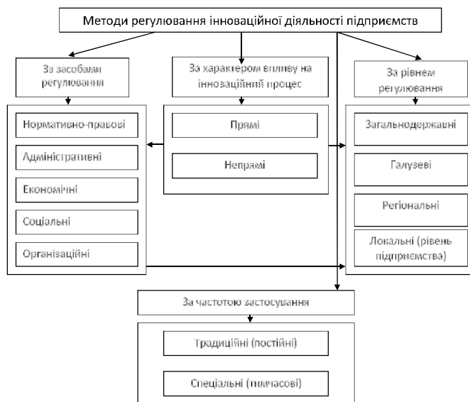
Рис. 2. Методи регулювання інноваційної діяльності підприємств

Основною метою інноваційної політики держави є формування сприятливої інфраструктури та клімату для здійснення інноваційної діяльності суб'єктами господарювання, використовуючи при цьому різноманітні методи та форми стимулювання (рис. 2.).