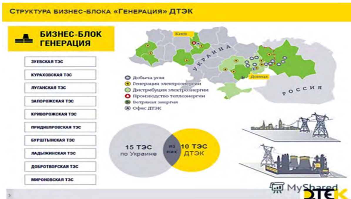
Рис. 1. Структура бізнес-блоку «Генерація» ДПЕК

ними конфліктами. Вочевидь, немає проблем у "ДПЕК Західенерго" і з платіжною дисципліною клієнтів. П'ята за розміром енергогенеруюча компанія України зі встановленою потужністю 4707,5 МВт активно продає електроенергію на експорт в країни Європи (рис. 1).