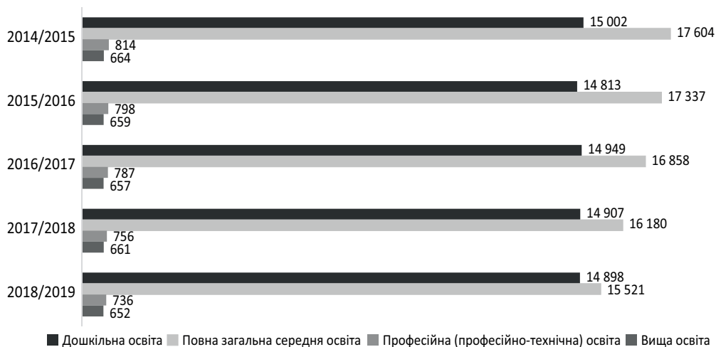
Рис. 2. Кількість закладів освіти за рівнями освіти в динаміці (2014/2015–2018/2019 н. рр.), одиниць

Упродовж 2014/2015–2018/2019 н. рр. кількість закладів освіти усіх рівнів зменшилась. Трансформація мережі закладів дошкільної, повної загальної середньої, професійної (професійно-технічної) та вищої освіти у бік зменшення здійснюється за рахунок оптимізації їх кількості, що відбувається, наприклад, шляхом реорганізації (ліквідації) закладів дошкільної, повної загальної середньої освіти та утворення на їх базі філій опорних закладів освіти. У 2018/2019 н. р. прослідковується зменшення загальної кількості закладів дошкільної освіти на 0,06 % (станом на кінець 2018 року), повної загальної середньої освіти на 4,1 %, закладів професійної (професійно-технічної) освіти на 2,6 %, закладів вищої освіти на 1,4 % (рис. 2).