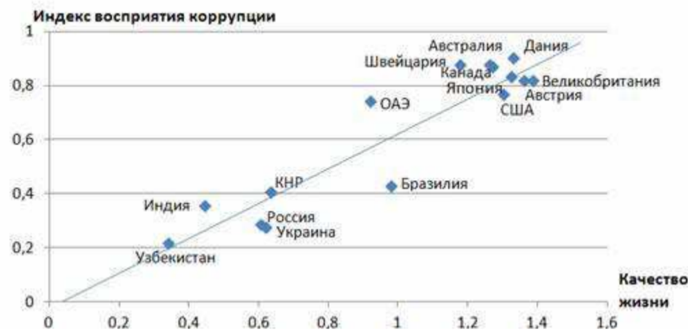
Рис. 1. Индекс восприятия коррупции – качество жизни

Одним из факторов наличия коррупции является показатель качества жизни. Он измеряет удовлетворенность отдельных граждан своей жизнью, включает как материальную обеспеченность, так и удовлетворение духовных потребностей ( http://www.smartcat.ru/Referat/ntceqramam/ ), здоровье, продолжительность жизни, условия окружающей человека среды [6].