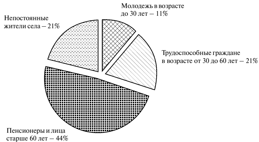
Рис. 5. Структура неформальных лидеров местных инициатив на примере Львовской, Волынской и Ривненской областей в 2010 г.

циатив терпят неудачи уже на стадии создания именно из-за отсутствия сторонников.