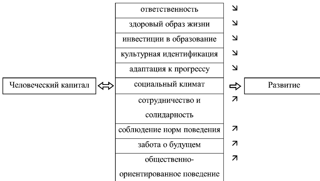
Рис. 6. Влияние человеческого капитала на развитие сельских территорий

зации РСТ, роли и места общины в этом процессе можно выделить группу человеческого капитала общины . Ученые и практики, особенно управленцы, отмечают существенную дифференциацию этой группы на селе. Поэтому можно считать, что человеческий капитал общин является весомым ресурсом развития сельских территорий и институционализации самих общин (рис. 6).