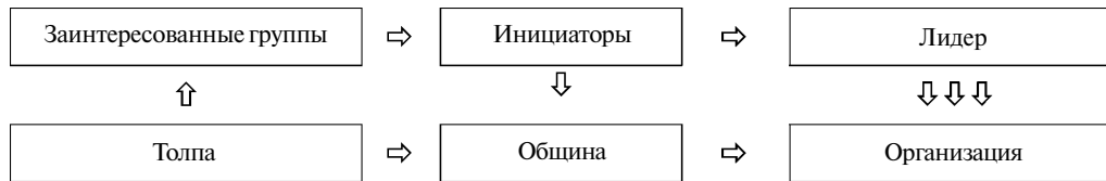
Рис. 4. Влияние лидеров на организационное становление общин и реализацию местных инициатив

лями органов местного самоуправления, инициативными гражданами и их неформальными лидерами.