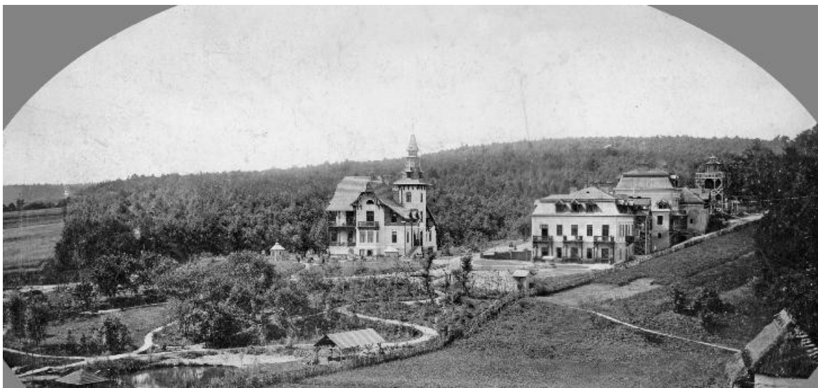
Рис. 2. Клімато- і гідротерапевтичний курорт Маріївка наприкінці XIX ст. [9].

Друге кільце штандортної теорії структурно-геопросторової організації приміської ТРС – це т. зв. пояс інтенсивної стаціонарної рекреації на периферії міста. Для Львівської приміської ТРС останньої третини XIX ст. характерною ознакою формування цього поясу стала поява “малих” бальнеологічних курортів-сателітів на зручних під’їздах до міста. Курортного статусу набули в цей період такі суміжні поселення як Велике Голоско, Рудно, Зимна Вода та ін. Найвідомішим курортом-сателітом Львова цієї доби стала Маріївка.