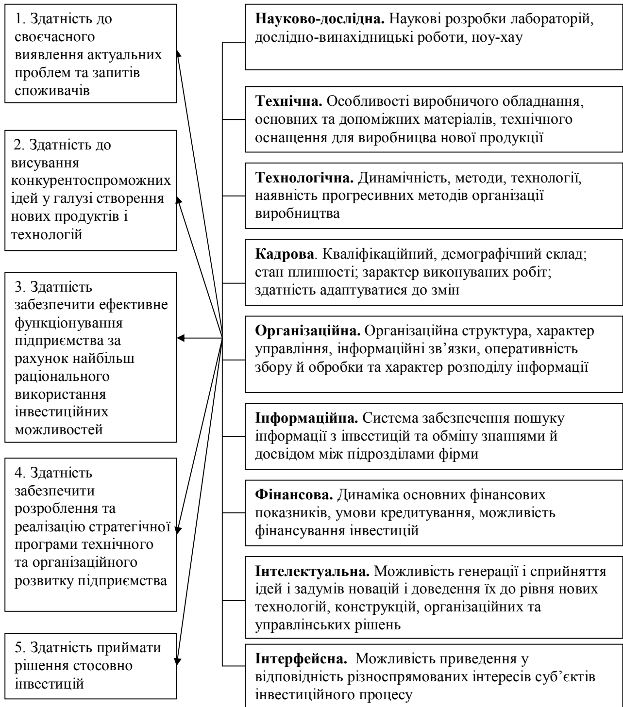
Рис 2. Складові інвестиційного потенціалу підприємства

Розвиток підприємства розглядається як реакція на зміни зовнішнього середовища і тому має стратегічний характер. Від стану інвестиційного потенціалу залежить вибір та реалізація інвестиційної стратегії і тому оцінка цього потенціалу є необхідною умовою змін.