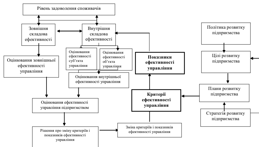
Рис. 1. Схема методології формування критеріїв та показників ефективності менеджменту підприємства (власна розробка)

Рішення про зміну критеріїв та показників