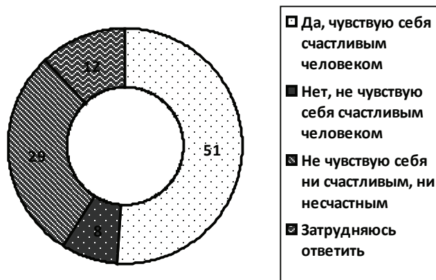
Рисунок 1. Распределение ответов на вопрос: «Чувствуете ли вы себя счастливым человеком?», (в %)

На социальное самочувствие людей положительно влияют их ощущения безопасности, уверенность в стабильном будущем. Однако, только 8 % опрошенных студентов отметили, что им хватает экологической безопасности, 10 % – качественного медицинского обслуживания, 22 % – уверенности в своем будущем, 23 % – защиты от преступности, 28 % – юридических возможностей защитить свои права и интересы. То есть, ощущения безопасности и уверенности в стабильном будущем не являются характерными для большинства студентов. А это, естественно, сказывается на характере иерархии их потребностей, а также на уровне их социальной ответственности и активности. Результаты опроса показывают, что такие чувства, как причастность к национальной культуре, национальная гордость не характерны для большинства респондентов.