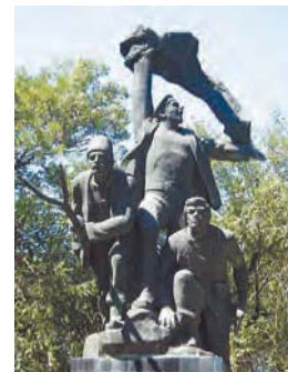
Памятник Татарбунарскому восстанию

Несколько часов провел Пушкин в Татарбунарах, сопровождая И. П. Липранди в его служебной поездке по Буджаку. Пушкин и Липранди прибыли в небольшой, но уже вполне состоявшийся и пристойный по тем временам городок. Важно то, что Пушкин видел и развалины бани, и «фонтан», скорее всего знал татарбунарскую и аккерманскую версии помянутой легенды.