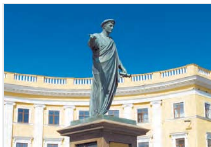
Памятник Дюку Ришелье в Одессе