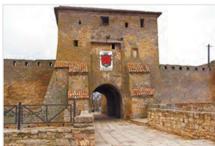
Аккерманская крепость (г. Белгород-Днестровский)

1 чел. около 180-200 грн.). Детям же особую радость доставит посещение Дельфинария Немо (средняя стоимость посещения около 150 грн.).