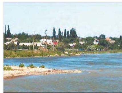
с. Шабо Белгород-Днестровского р-на

ризма и способствуют этому, прежде всего, благоприятные природно-климатические условия для выращивания виноградной лозы, завезенной на территорию региона швейцарскими и немецкими колонистами, крупными помещиками. Показательным в этом смысле является с. Шабо Белгород-Днестровского р-на – древний винодельческий регион расположен на так называемой «виноградной широте», то есть на одной широте с лучшими виноградниками мира: такими как Бордо и Бургундия.