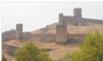
Турецкая крепость Измаил