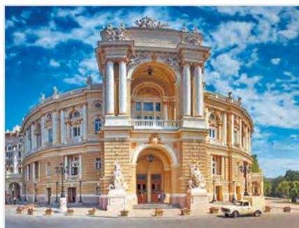
Одесский оперный театр

Для ценителей крепких напитков предусмотрены: винный тур в «Шабо», экскурсия на коньячный завод «Шустов», а также знакомство с торговой маркой «Колонист».