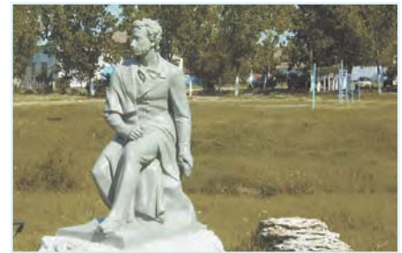
Памятник Пушкину (г. Татарбунары)

онного значения в Одесской области Украины, административный центр Татарбунарского района.