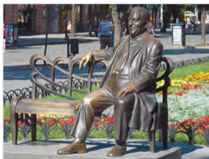
Памятник Л. Утесову (г. Одесса)

Черного моря; Одесса-мама; Южная Пальмира – так говорят, поэтически сравнивая его с Пальмирой – городом легендарной красоты; Южная столица Украины.