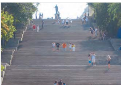
Одесса. Потемкинская лестница

вительство, укрепляя свои северные границы, начало строить у порта крепость Ени-Дуня (Новый Свет). Во время очередной русско-турецкой войны. С V века до н. э. – группа античных поселений. Современный город как военно-морской порт на Черном море основан Российской империей в 1794 году на месте татаро-турецкого поселения Хаджибей (известного с XV века и отошедшего к России в 1791 году); переименован в Одессу (предположительно, от античного города Одессос) в 1795 году. К концу XIX века Одесса превратилась в четвертый по величине город и второй по грузообороту порт Российской империи. Впервые новое название города встречается 10 (21) января 1795 года. Название связано с древнегреческой колонией Одессос. В те годы предполагалось, что античный Одессос существовал неподалеку от Одесского залива (позже археологи нашли эту колонию недалеко от болгарского города Варны). Еще одна легенда гласит, что новое название долго не приживалось, и люди по-прежнему называли Одессу Хаджибеем. Поэтому для лучшего усвоения населением нового названия власти применили следующий метод. На всех городских заставах казаки спрашивали въезжающих крестьян: «Куда путь держите?» И если следовал ответ: «В Хаджибей», казаки этого человека просто пороли. Метод оказался действенным, и вскоре уже все именовали город Одессой. Среди неофициальных названий: Жемчужина