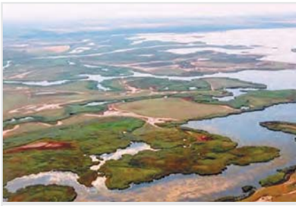
Дунайский биосферный заповедник

рукава. Над ровной поверхностью заповедника, изрезанной массой рукавов и проток, едва выделяются приморский и приречный валы и наиболее возвышенный участок заповедной территории – Жебриянская песчаная гряда, по которой проходит автодорога Татарбунары-Вилково.