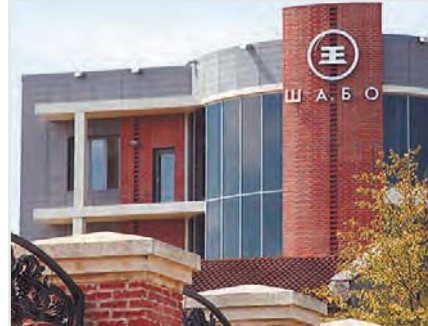
Винный завод «Шабо»

Виноделие в с. Шабо начало развиваться на заре XIX века, когда на этой территории была основана колония швейцарских переселенцев. Сегодня в с. Шабо действует винодельческое предприятие, известное не только в Украине, но и далеко за ее пределами – Общество