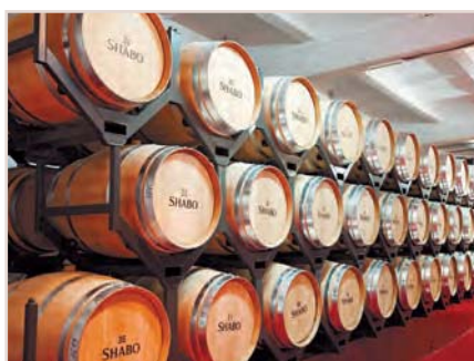
Винные погреба в с. Шабо

В Одесской области с каждым годом возрастает популярность винного ту-