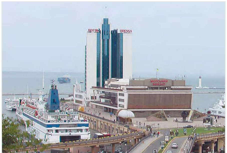
Морвокзал в Одессе

К услугам туристов пешие прогулки, автомобильные и автобусные экскурсии, катание на катере. Гостям города предлагаются экскурсии по Одессе, а также загородные туры. Чаще всего туристические фирмы предлагают обзорные экскурсии по городу, экскурсии по одесским катакомбам, храмам и дворцам.