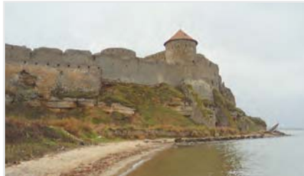
Аккерманская крепость (г. Белгород-Днестровский)

своей мощью: два километра защитных муров, в некоторых местах достигающих 5 метров в ширину, глубокий ров, который в случаях необходимости заполнялся водой, около тридцати башен. Эта крепость долгое время служила оборонным пунктом. В наше время она привлекает внимание не только туристов. На фоне стен крепости снимаются исторические фильмы, периодически проводятся различные фестивали. Посещение Аккерманской крепости (средняя стоимость на