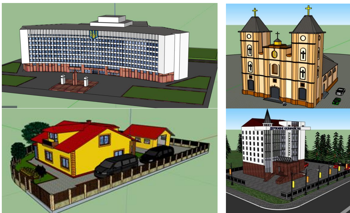
Рис. 4. Зразки проектів моделювання архітектурних споруд м. Івано-Франківська та приватного будинку

За допомогою отриманої статистики, можна зробити висновок, що завдання є цікавими, інструкції зрозумілими, проектна діяльність учнів була добре організована та скоординована, а оцінювання робіт об'єктивним. Як показує дослідження, учням надзвичайно цікаво займатись 3D-моделюванням архітектурних споруд, оскільки вони після завершення роботи над проектом отримують наочний результат, і можуть порівняти та оцінити відповідність своєї 3D-моделі оригіналу. Отож результати опитування свідчать про те, що школярів цікавить процес 3D-моделювання і даний курс має перспективи для подальшого розвитку.