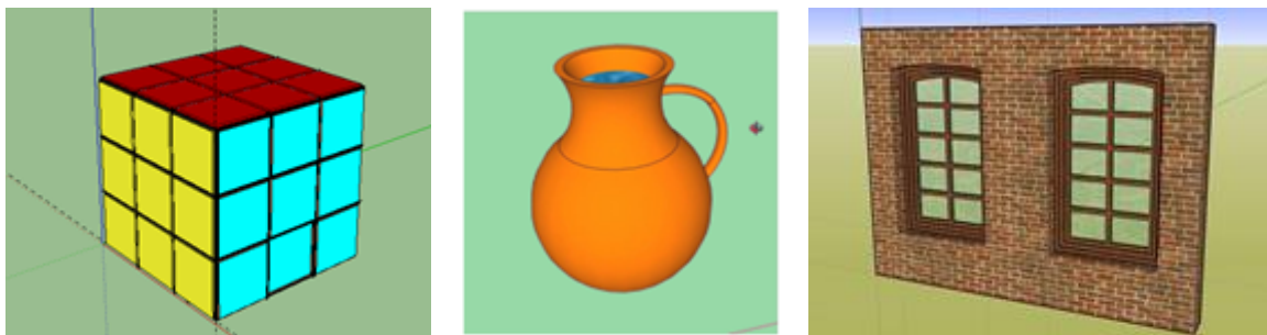
Рис. 3. Створення простих 3D-об'єктів та поверхонь обертання

Найкраще учні справилися з проектами моделювання відомих архітектурних будівель нашого міста, напевно, цьому сприяла висока мотивація, громадянська свідомість та патріотичний дух.