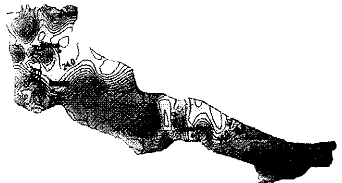
Рис. 3. Карта изоконцентраций лития в почвенном горизонте 5,0-15,0 см на территории УЩ.

Результаты исследований почв на территории УЩ позволили установить, что существуют определенные