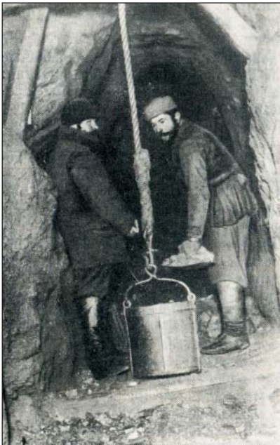
Підйом руди на-гора в руднику Шмаковому Криворізького басейну. 1908–1909

Подібна доля спіткала і підприємство з розробки аспіду. На початку 1872 р. О. Поль разом із князем С.В. Кочубеем розпочав розробку аспідного сланцю, родовище якого містилося за 6 кілометрів від Кривого Рогу, в с. Покровському. Це родовище було відоме ще з козацьких часів і славилось якісним матеріалом, який використовували для покривання дахів і настилання підлоги. 1872 р. Поль їздив до Європи з метою вивчення досвіду промислового видобутку аспіду. Того ж року розпочалась