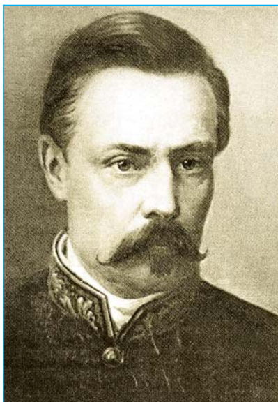
Олександр Миколайович Поль

1787 року район Кривого Рогу відвідав професор М.Г. Ліванов. Він знайшов там залізні, срібні (лише за його даними) та інші руди і доповів про це князю Григорію Потьомкіну, який наказав побудувати в тих місцях чавуноливарний завод. Але смерть намісника