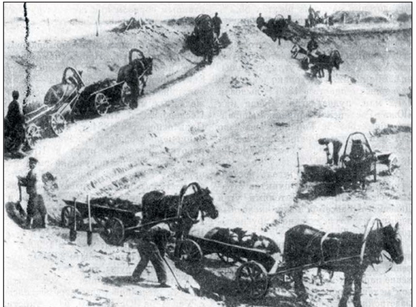
Вивіз руди з кар'єру в Кривому Розі