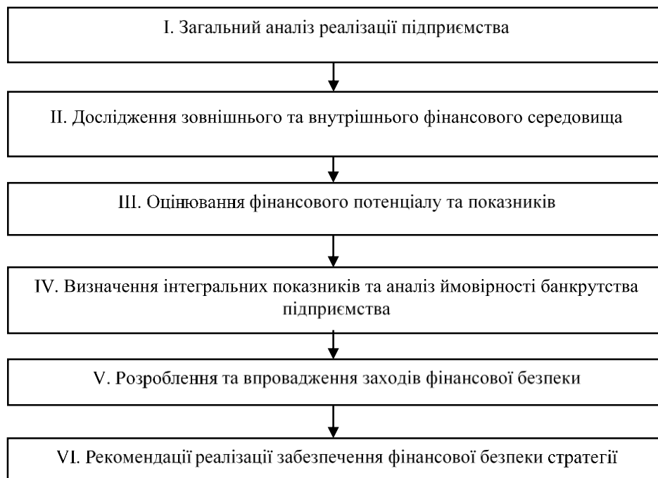
Рисунок 1. Етапи визначення рівня фінансової безпеки на підприємстві

Для покращення фінансово стану підприємства забезпечення підвищення його фінансової безпеки є важливим. Основні етапи визначення фінансової безпеки підприємства наведено на рис. 1.