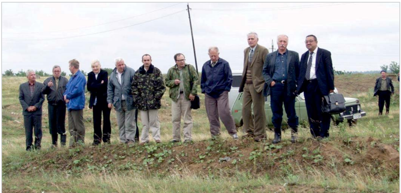
Рис. 3. Группа специалистов на натурном обследовании территории ГАЭС