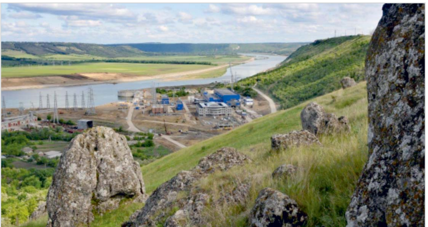
Рис. 2. Фрагмент Днестровского склона в естественном состоянии.

Организация мониторинга — история и настоящее. Принципиальные подходы к созданию и организации системы натурального контроля Днестровской ГАЭС основывались, с одной стороны, на положениях нормативных и рекомендательных документов, действующих в то время в области гидроэнергетического строительства, когда обязанности за организацию контроля за безопасностью строящихся сооружений возлагали на