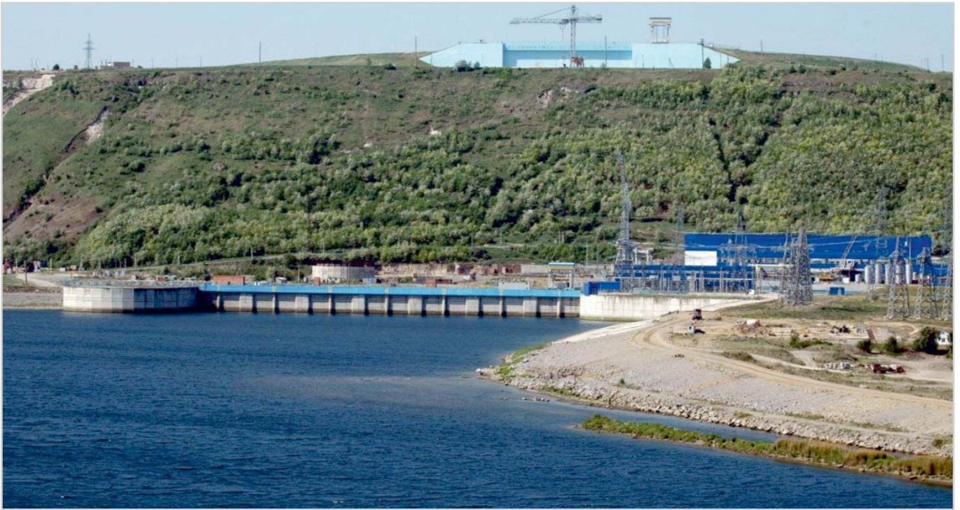
Рис. 1. Днестровская ГАЭС. Вид с нижнего бьефа.

тория, как всем известно, это подтвердила. Из этого следовало, что за долгие годы строительства, будет меняться и совершенствоваться система контроля, включая как ее объем, так и направления контроля и методологии. Было ясно и другое — за этот период, в силу объективных обстоятельств, будет утрачено определенное количество КИА и на разных этапах строительства придется потратить много сил и средств, чтобы сохранить или восстановить техническую составляющую системы контроля на необходимом, но достаточном уровне безопасности. Такой под-