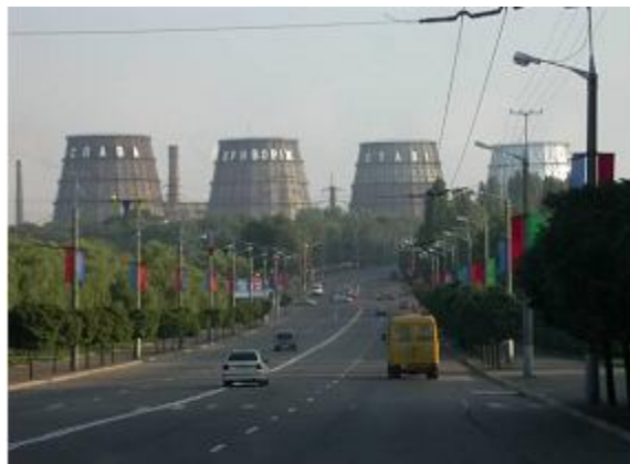
Рис. 1. Мережа ГНСС спостережень

Автоматизована система моніторингу надсилає результати добових ГНСС-спостережень. Для проведення обробки результатів вимірювань, отриманих системою автоматизованого деформаційного моніторингу, в програмному пакеті необхідно знати найстабільніші пункти мережі, тобто необхідно визначити просторові положення пунктів на епоху відповідного циклу спостережень з урахуванням зміщення всіх пунктів мережі і вибрати найбільш стабільні пункти. Для цього, використовуючи величини проекцій вимірюваних векторів на відповідні координатні осі \Delta x , \Delta y , \Delta z , для кожного повторного циклу спостережень виконано врівноваження параметричним методом. За цими даними знайдено середні квадратичні відхилення проекції вектора між всіма пунктами від його середньої величини. Також обчислено ненормовані і нормовані кінематичні коефіцієнти для кожного пункту, величини яких свідчать стабільність пунктів. За величинами середньо вагових зсувів по осях координат кожної пари пунктів з урахуванням кінематичних коефіцієнтів знайдено середньо ваговий зсув усієї мережі, викликаний її деформацією, зміщення середньої висоти мережі за результатами врівноваження і кінцеві зміщення пунктів, викликані деформацією мережі. За результатами врівноваження кожного циклу отримані середні квадратичні похибки (СКП) визначення координат з урахуванням похибок вимірювань і похибок моделювання кінематики пунктів. Отримані результати використані для визначення найстабільніших пунктів мережі.