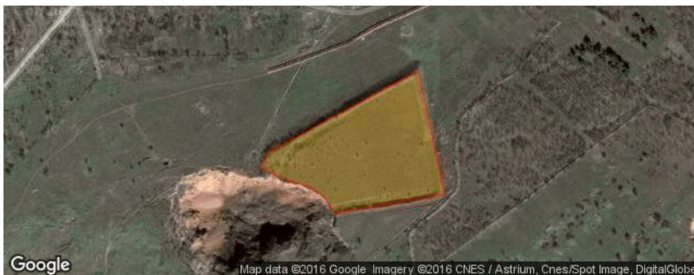
Рис. 3. Фрагмент руїн шламосховища м. Кривий Ріг на космічному знімку

з минулим темпи видобутку корисних копалин вирости в рази. Тільки за останні десятиліття підприємства ГМК міста переробили понад 480 млн. тонн залізної руди [7-9]. В результаті регіон отримав ряд серйозних екологічних проблем, до яких можна віднести порушення гідродинамічного режиму підземних вод, забруднення поверхневих вод, ґрунту, атмосферного повітря. До цього варто додати істотні зміни геологічних, гідрогеологічних та гідрологічних станів навколишнього середовища. Причин безліч: шахти, кар'єри, знамениті криворізькі відвали і шламосховища (рис. 3), які тиснуть на поверхню, скидання в місцеві річки щорічно до 30 млн. м 3 високо-мінералізованих вод. Сучасний стан цієї системи такий, що Кривий Ріг буквально висить над безоднею.