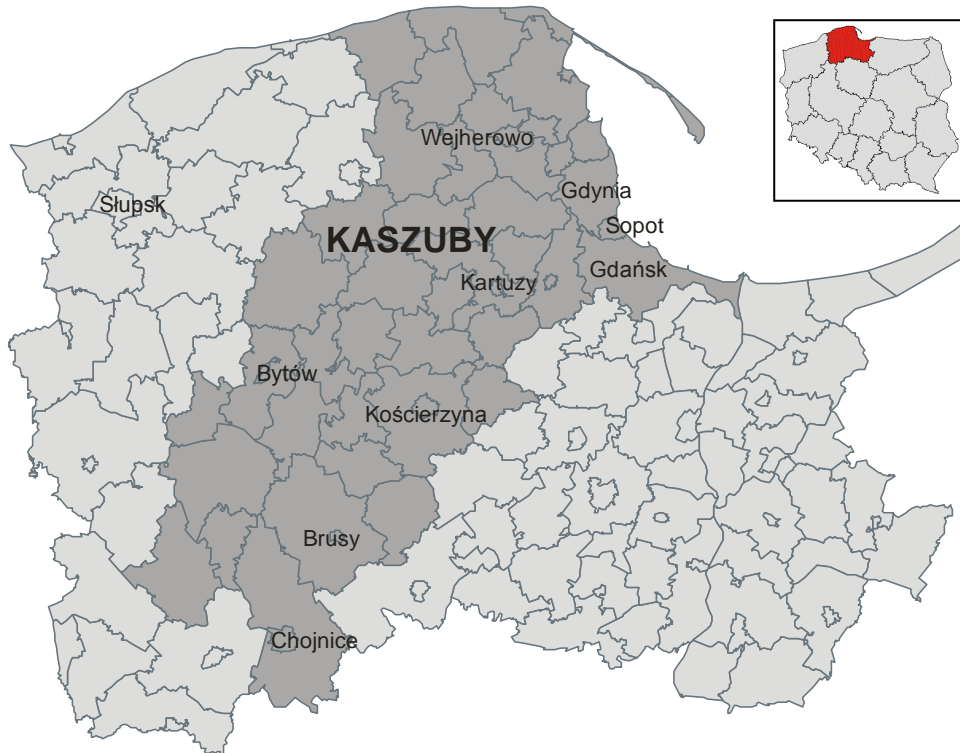
Ryc. 1. Obszar współczesnych Kaszub na tle województwa pomorskiego

Współczesne Kaszuby to 43 gminy w powiatach: puckim, wejherowskim, lęborskim, bytowskim, kartuskim, kościerskim, chojnickim i człuchowskim oraz miasta: Gdańsk, Gdynia i Sopot. Obszar Kaszub to 6200 km 2 .