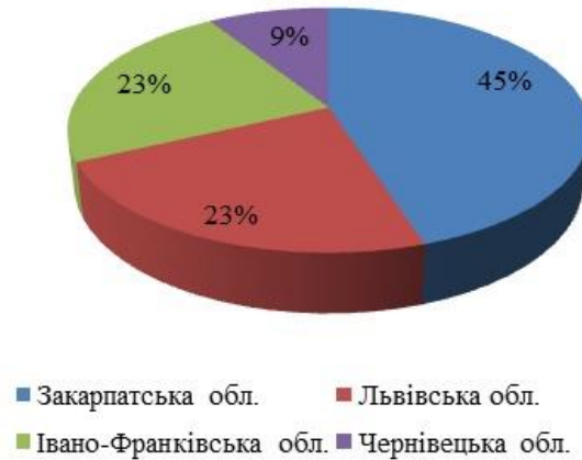
Рис. 2 Співвідношення гастрономічних фестивалів по областях Карпатського регіону

Таким чином, найбільше гастрономічних фестивалів проводять у Закарпатській області (45 %), друге місце посідають Львівська та Івано-Франківська області (по 23 % відповідно), найменше таких фестивалів (9 %) проводять в Чернівецькій області (рис. 2).