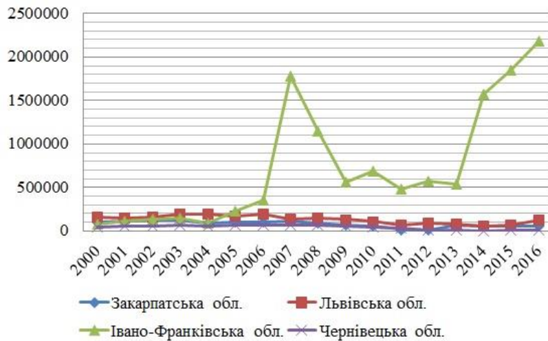
Рис. 1. Динаміка туристичних потоків Карпатського регіону

Виклад основного матеріалу. Туризм в Карпатському регіоні активно розвивається, про що свідчать високі показники туристичних потоків. Одним із лідерів за цим показником є Івано-Франківська область, що пов'язано із стрімким розвитком курорту Буковель та великою кількістю екскурсантів (рис. 1) [9-12]. Окрім того, у 2016 р. у кожній із областей Карпатського регіону спостерігається збільшення кількості туристів, що можна пояснити розвитком внутрішнього туризму. Туристів в тому числі приваблюють гастрономічні фестивалі.