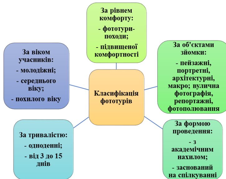
Рис.2 - Класифікація фототурів

Закордоном фототуризм є одним з популярних видів відпочинку. Приблизно 30 років тому він почав свій розвиток у Європі, яка найбільше підходить для тематичних зйомок. Так, наприклад, для Скандинавії характерний піший туризм з відвідуванням національних парків, таких як Сарек, Рондане, Абіску, Юре, Тіведен тощо; для Іспанії характерний екскурсійний туризм і відвідування таких об'єктів, як Національний парк Гауді, музей Сальвадора Далі; Греція відкрита для відвідування всесвітньовідомих визначних місць, таких як Акрополь, Метеори, Олімп, які є чудовим об'єктом для поєднання архітектурної та вуличної фотографії [6]. Фототури в Ізраїль, Марокко, Туніс,