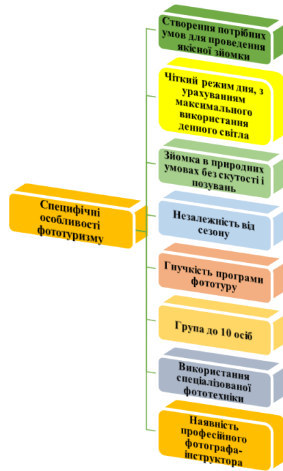
Рис.1 - Специфічні особливості фототуризму

для довгої подорожі та зміни міст. Розподіл туристів за віковою категорією є важливими аспектом туру, адже молодіжні тури, як правило, розраховані на більшу кількість піших прогулянок, для середнього та похилого віку – на можливість більшу частину туру проїжджати [4].