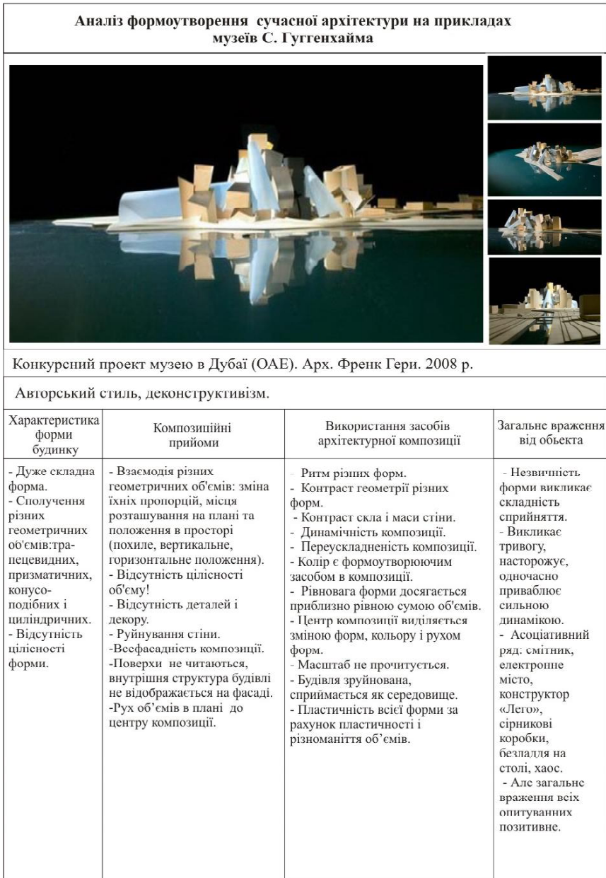
Таблиця 1. Продовження