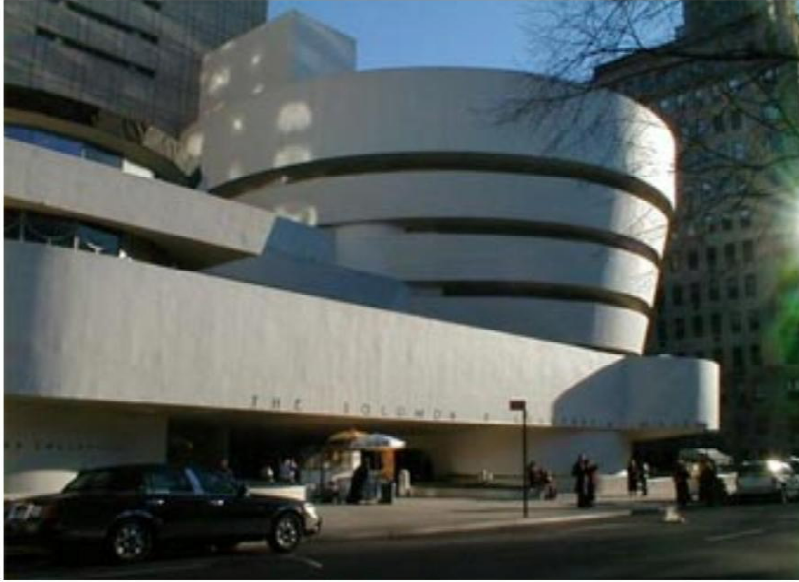
Музей С.Гуггенхайма, Нью-Йорк. Арх. Ф. Л. Райт. 1943 – 1959рр.

Архітектурний стиль - модернізм. Напрямок - органічна архітектура.