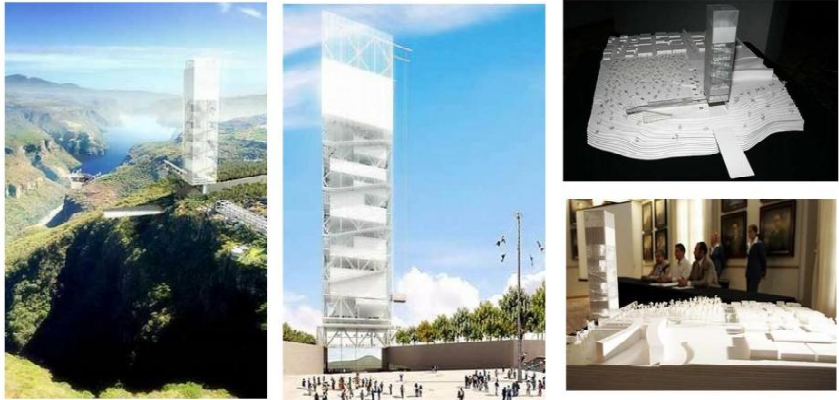
Проект музею у Гвадалахарі (Мексика). Арх. Енріке Нортен. 2008 р.