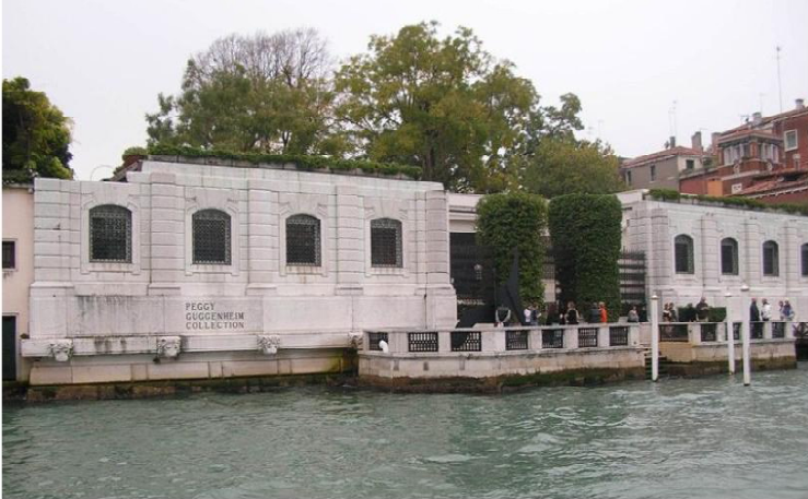
Резиденція Пеггі Гуггенхайм, Венеція. (Palazzo Venier dei Leoni). Арх. Баскеті. 1749 р.