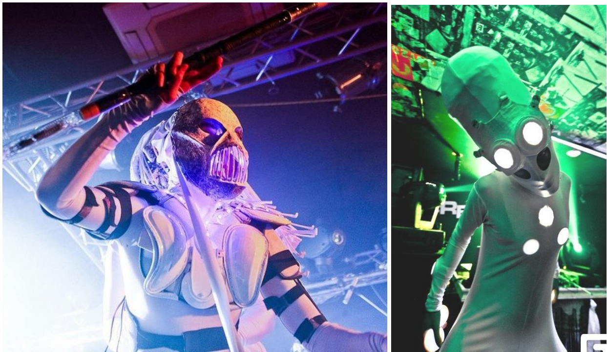
Рис. 4. Космічні загарбники та прибульці в образах акторів фрік-шоу