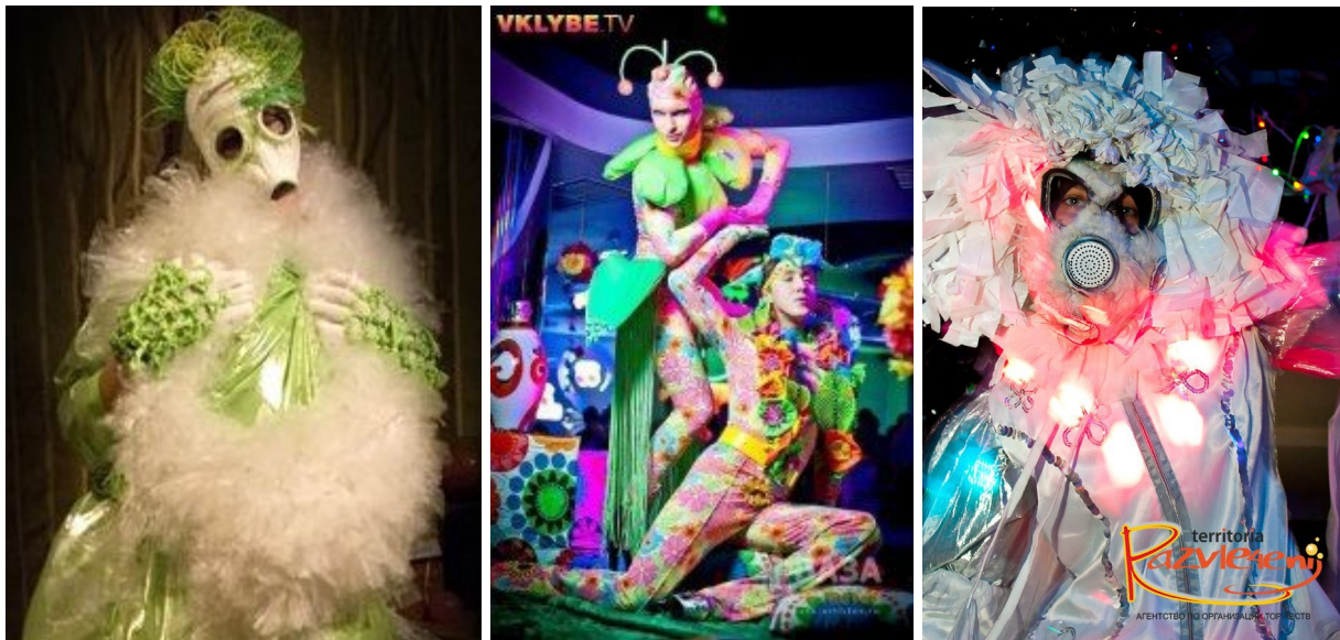
Рис. 6. Приклади створення позитивних персонажів фрік-шоу

Присутня сьогодні у фрікових шоу-програмах й кібернетична тематика, в цьому випадку на сцені, танцполі чи будь-якій іншій робочій площадці крокують громіздкі роботи, рясно оснащені світлодіодною технікою, вражаючи креативом дизайнерів у використанні нетрадиційних матеріалів при створенні костюму (рис.5).