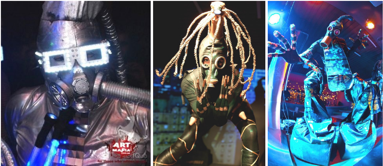
Рис. 3. Приклади використання засобів індивідуального захисту в костюмі для фрік-шоу