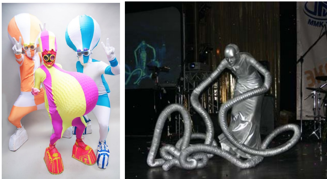
а – фрик-шоу «Peasok» (м. Нижній Новгород); б – костюми компанії Fashion Twins Group (м. Москва)