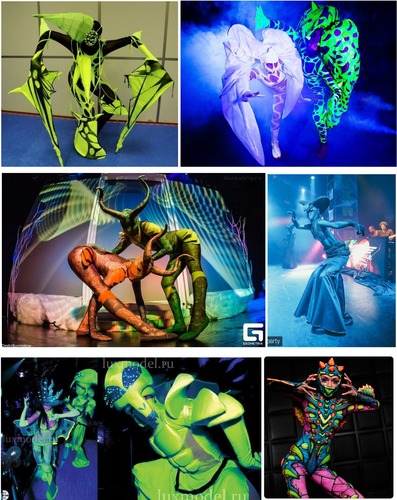
Рис. 2. Приклади синтезу морфологічних ознак різних живих істот в художньому образі фрік-артиста