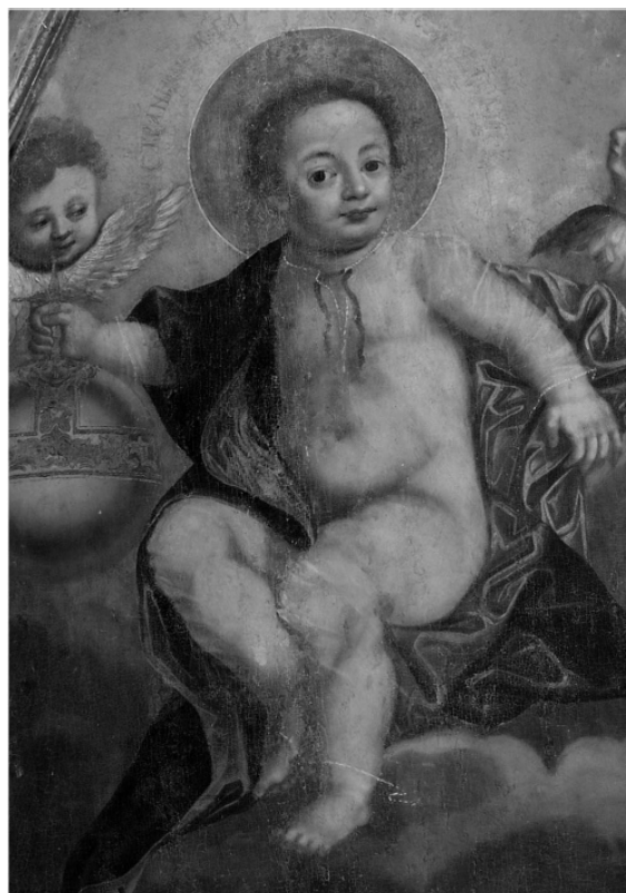
Рис. 10. «Портрет Олександра I-го дитиною». Невідомий художник другої пол. XVIII ст., х.м., 82×65, ДТГ