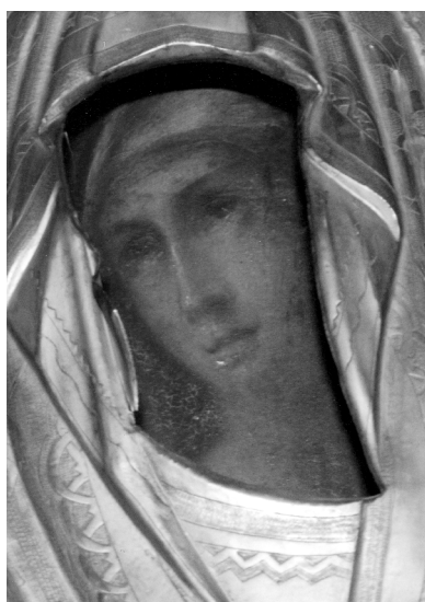
Рис. 4. Ікона «Пресвята Богородиця — Симоново Проречення», 1745–1754, Інв. У–284, НЗСК, фрагмент. Іконостас собору Софія Київська