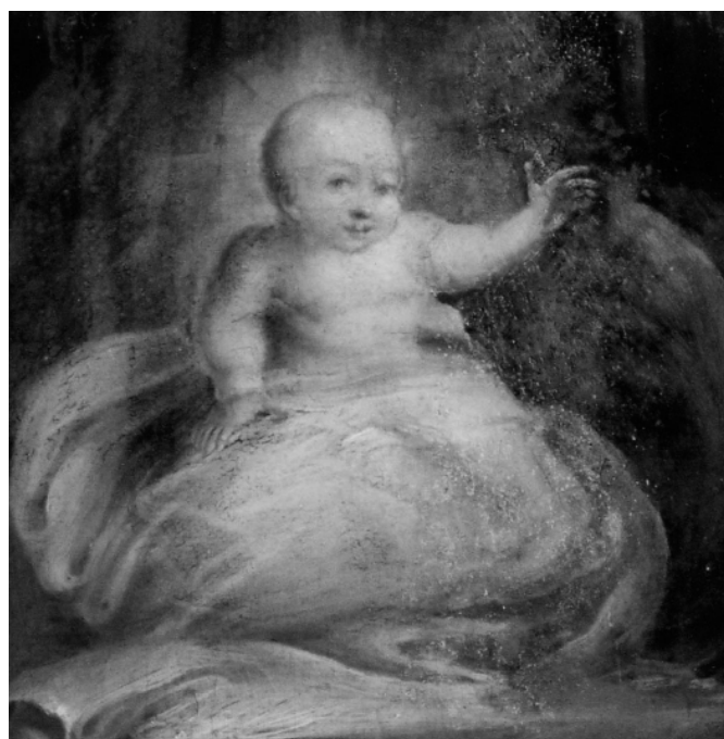
Рис. 12. «Свята Марія», фрагмент ікони «Різдво Богородиці», 1747–1754 рр., д.м., 166×73,5, іконостас собору Св. Софії Київської