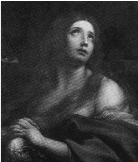
Рис. 6. Альбані Франческо «Свята Магдалина, що молиться», 1620–1630, Музей Конде, Франція