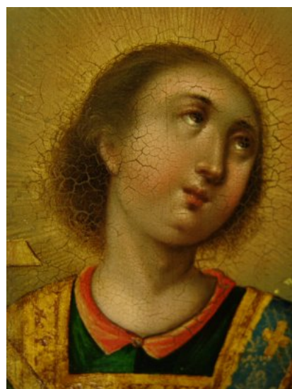
Рис. 5. «Св. перв. архідиякон Стефан», 1767 р., КПЛ–ж–122, НКШКЗ, фрагмент