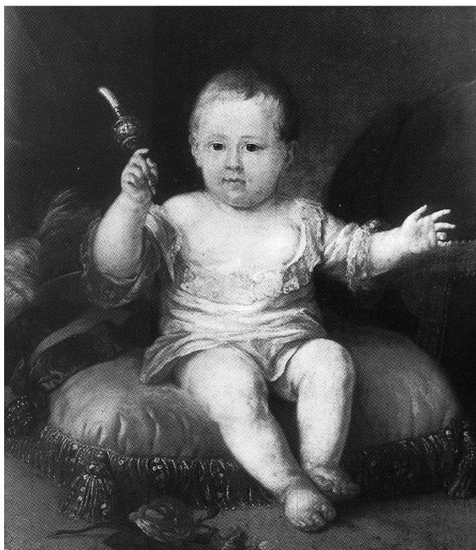
Рис. 9. Карлеваріс Маріана (?), Венеція, пер. пол. XVIII ст. «Портрет дитини в образі амура». х.м., 66×56,5 Москва, ДМІМ