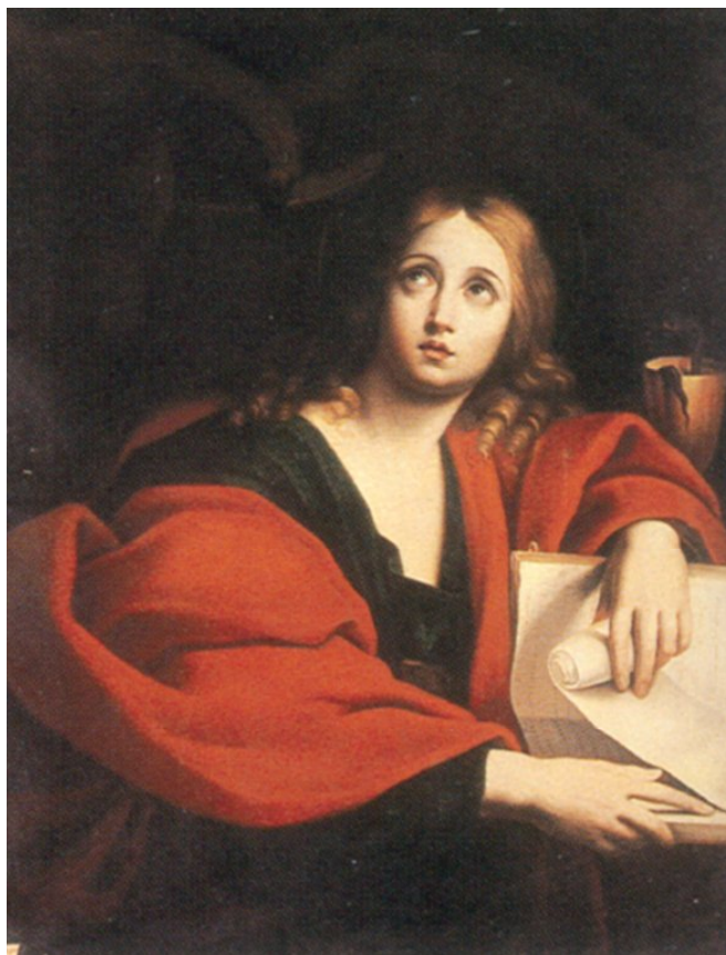
Рис. 2. Доменікіно Цамп'єрі «Євангеліст Іоанн Богослов», 1630, ДЄ.