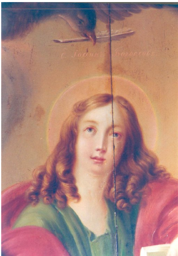
Рис. 1. Ікона «Св. ап. Іоанн Богослов», 1745–1754, Інв. У–283, НЗСК, фрагмент. Іконостас собору Софія Київська.