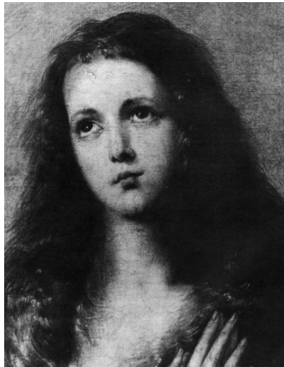
Рис. 7. Ріберо Джузеппе «Свята Агнеса», 1641, Дрезденська галерея, Німеччина