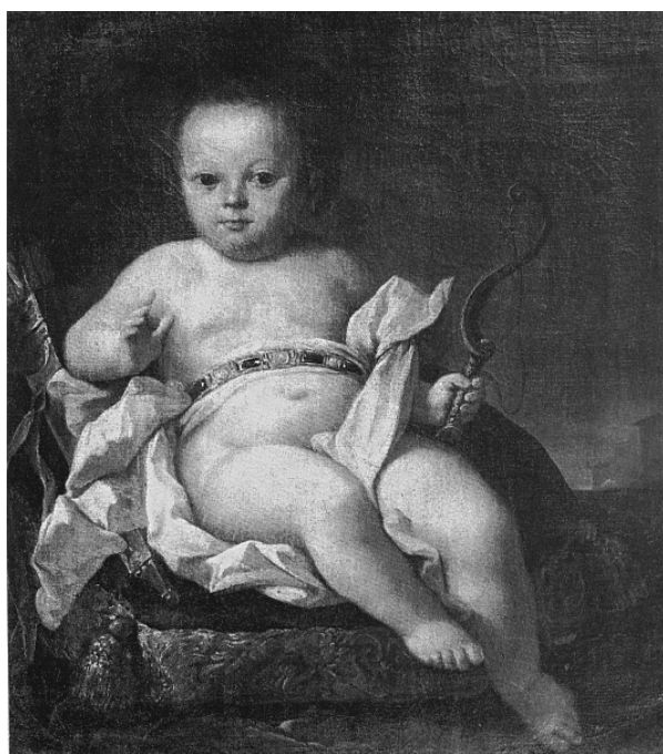
Рис. 11. «Немовля Христос» (фрагмент ікони), XVIII ст., д.м., НКПІКЗ