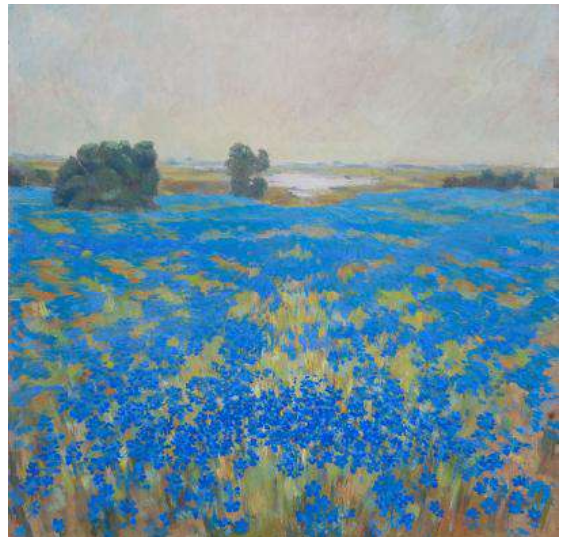
Іл. 9. К. Литвин. Льон цвіте. 1990. 50 × 50. Зберігається в родині художника.