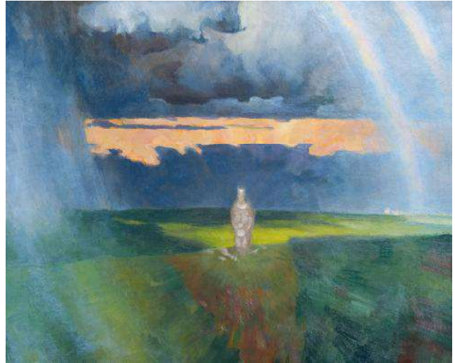
Іл. 7. К. Литвин. Степ. 1982. 50 × 60. Зберігається в родині художника.