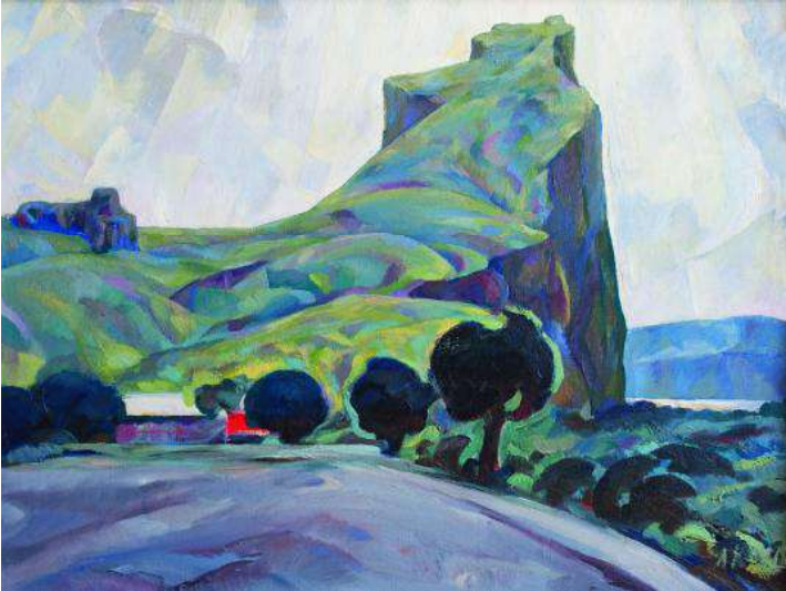
Іл. 1. К. Литвин. Девін. 1970. Полотно, олія. 100 × 75. Зберігається в родині художника.