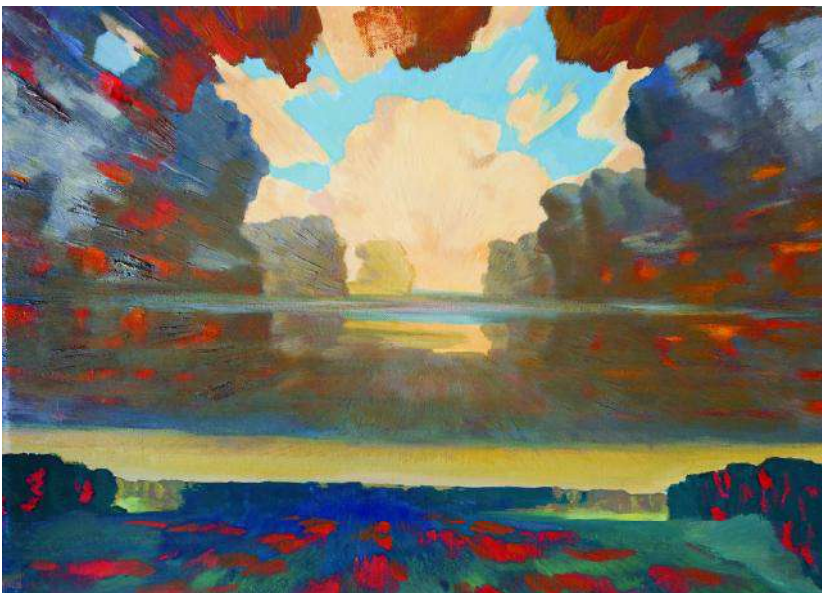
Іл. 10. К. Литвин. Берестецьке поле. 1996. 63 × 85. Зберігається в родині художника.