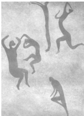
Настінний живопис ілюструє співіснування танцювальної техніки періоду неоліту: стрибки, дугоподібні вигини тіла, рухи та пози рук, обертання

соціальних інстинктів і душевних здібностей людей через загальні танцювальні рухи, що значною мірою розширило й ускладнило процес соціального наслідування, культивування людини. Необхідно звернути увагу на те, що основна форма виконання масового танцю — коло, яке є зручною формою і має ведівський сенс, пов'язаний з культами Сонця та Місяця. Масовість — необхідна умова танцю. Підтвердження цьому є стіна в печері Ур на горі Пелегріно, Сицилія, (8 тис. до н.е.), що являє собою груповий танець. Сім танцюристів рухаються по колу навколо двох центральних персонажів. Ці останні виконують на землі судороги, кривляння. Усі босоніж, але носять маску на обличчі. Ця вистава нагадує нинішні африканські танці. Колом керують лідери в центрі. Носіння маски тварин належить до ритуалу, це акцентує стан прагнення до знеособлювання, у чому стверджувалася єдність групи і нерозривний зв'язок із нею кожного члена.