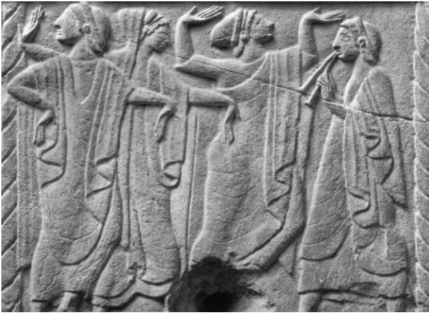
Пам'ятник із зображенням танцювальної сцени(дії) (IV–III тис. до н. е.) Барельєф. Етруське мистецтво. Національний археологічний музей Палермо

Жіночий танець, по суті, міг забезпечити все: багатий урожай, удале полювання, відвести небезпеку, що загрожує, посуху, тому і використовувався не лише для психологічного впливу на членів племені, а й об'єднання всіх членів племені заради спільної мети. Узагалі, приводи до танців і їх сюжети диктувало саме життя. Так, у танцях, що зображують тварин, відпрацьовуються полювальні прийоми.