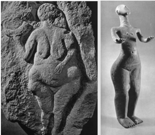
«Жінка з кубком». Ваньяковий рельєф (Лоссель, департамент Верхні Піренеї, Франція). Верхній палеоліт. Музей образотворчих мистецтв. Бордо Жіноча статуетка. Скульптура, глина. Ленд ельська культура. Енеоліт. Приватна колекція. Босковитейн. Чехословаччина

Усі ці положення тіла відображають розмірений та ритмічний ряд руху: звичайно, — це форма танцю. У багатьох доісторичних печерах є малюнки перетворення людей на тварин і знову на людей зліва направо. Це радше священні танці. За дослідженням А. Леві-Брюля, виконавці тотемного танцю одягали шкіру тварин та відчували себе «реально перетвореними на пантер і леопардів» [2, с. 126]. У багатьох випадках такі танці виконувалися до знемоги протягом декількох днів, особливо під час обрядів ініціації, а також голоду, війн, іноді призводячи до дуже сильного виснаження і смерті виконавців. Але первісна людина вірила, що тотем поверне їм життя. Подібні танці, що демонструють зв'язок людини з природою, притаманні всім шаманам, ламам, дервішам, мусульманським екзоцистам, африканським чаклунам всюди у світі й усі часи, для ствердження своїх сакральних