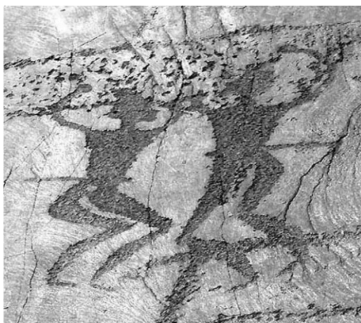
Парний танець. Петрогліф. Ущелина Сармиш. Узбекистан. (9 тис. до н. е.)

цінностей. Отже, з первісних часів такі танці використовували для виховання соціально пристосованої людини до навколишнього світу через силу впливу танцю.