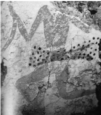
Розпис на Catal Ноуик (Чатал-Гуок), Турція. Це лише фрагмент, знайдений у місці, де археологи змогли відновити десяток інших танцюристів у симетричній опозиції (Музей Анкара)

Спільна людська діяльність — полювання — сприяло об'єднанню в людський соціум. А масові танці підсилювали культуротворчу активність людської групи, набуття навичок боротьби за існування, вироблення