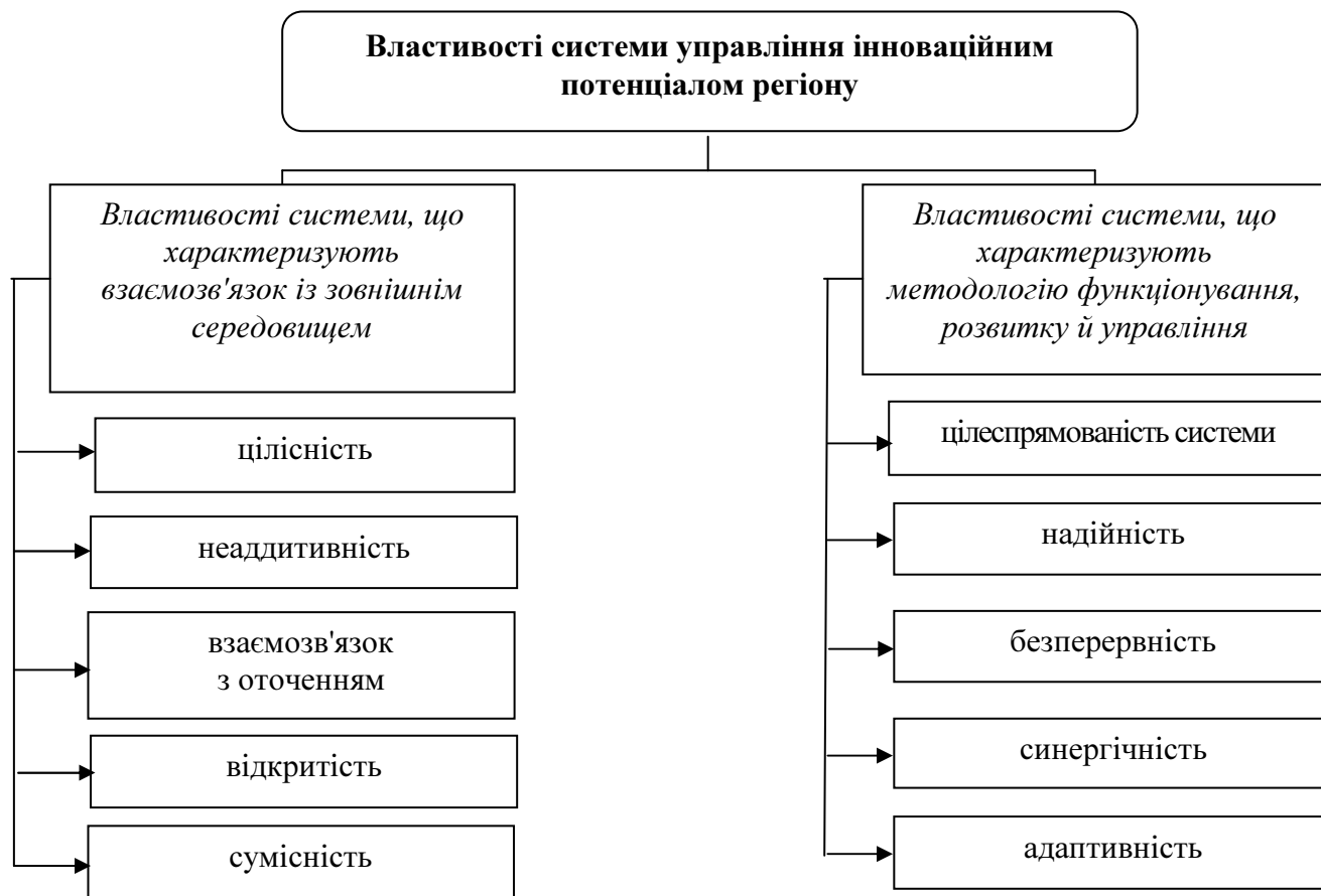
Рис. 2. Властивості системи управління інноваційним потенціалом соціо-економічної системи регіону

складі єдиного будь-яка його частина зобов'язана своїм існуванням дії інших і існує заради інших, і що тільки в таких умовах буття можливе і фізично виправдане [6]. Причому, система здобуває нових особливостей, якими не володіють її окремі складові елементи. Головною особливістю систем є виникнення додаткової енергії.