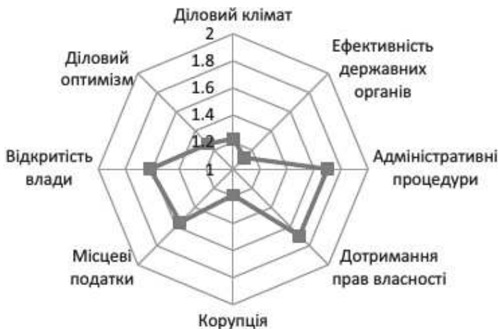
Рис. 1. Інвестиційна привабливість Сумської області: м'які фактори

Усунення бюрократичних та корупційних перешкод та спрощення адміністративного регулювання підприємницької діяльності є запорукою залучення інвестицій в економіку області. Потрібно максимально спростити адміністративні процедури та збільшити прозорість діяльності органів, які мають контролюючі функції щодо підприємств.