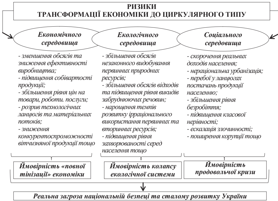
Рис. 1. Ризики, що супроводжують трансформаційні економічні процеси в забезпеченні положень циркулярної економіки