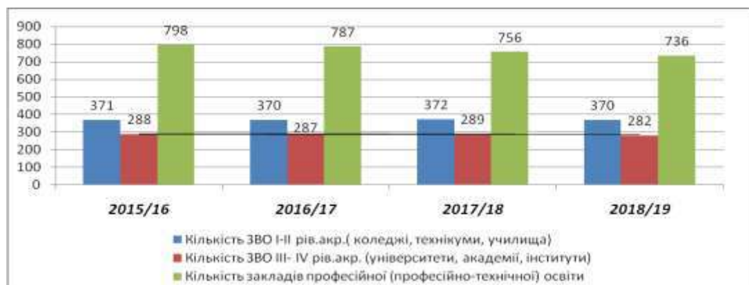
Рис. 1. Динаміка змін професійно-освітніх закладів