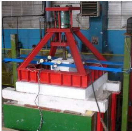
Рис. 1. Вид натурної установки для випробувань [10]

розроблений прогресивний метод з визначення температурних переміщень конструкцій шляхом експериментально-теоретичного дослідження їх ненагрітих аналогів [10]. Розроблений метод є ефективною технологією проведення досліджень конструкцій при дії віртуальних температурних полів. Його важливими особливостями є простота та низька вартість експериментальної частини, фізична прозорість та логічна обґрунтованість отриманих результатів. Для верифікації запропонованого методу були використані результати натурального дослідження залізобетонних плит на продавлювання при нагріві (рис. 1).