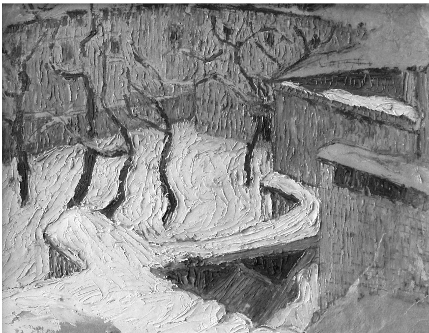
Вигляд з балкону. Зимовий етюд. 1918. Друкується вгору. З фондів Харківського художнього музею

зиційне рішення дає відчуття ніби ми опиняємось на горді, серед лісу чи на подвір'ї Софійського собору.