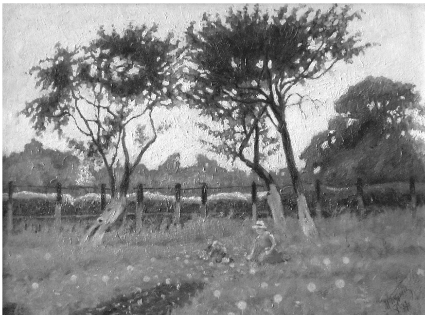
Вечір в садку. Картон, олія. 1937. Друкується вперше. З фондів Харківського художнього музею

полотні усе зведено до значних і цілісних мас. Вдало, органічно вирішена урівноважена та симетрична композиція. Чітко витримані силуети; великі протяжні лінії знаходять продовження у суміжних формах. Зліва та справа видніються групи дерев, натомість вода у центрі просвічена місячним сяйвом. Розлючені хвилі Дніпра гармонійно поєднуються з тривожно-напруженим вечірнім небом. Силуети дерев на передньому плані посилюють неспокійний стан природи. Колористичне рішення побудоване за допомогою поєднання теплих та холодних кольорів. Вертикалі композиції чітко контрастують з горизонталлями, надаючи твору поетичного настрою. У полотні помітний живий образ, який широким потоком насувається на глядача і справляє враження бурі, протесту і захоплення красою української ночі та розхлюпуючих хвиль Дніпра.