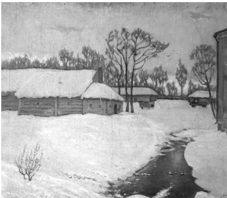
Березень. Полотно, олія. 1940. Друкується вперше. З фондів Харківського художнього музею

лану пшениці та пагорба, створюють симфонію літнього святкового дня. Полотно вирішене у теплому колориті, де об'єднувальним є наявність вохристих півтонів.