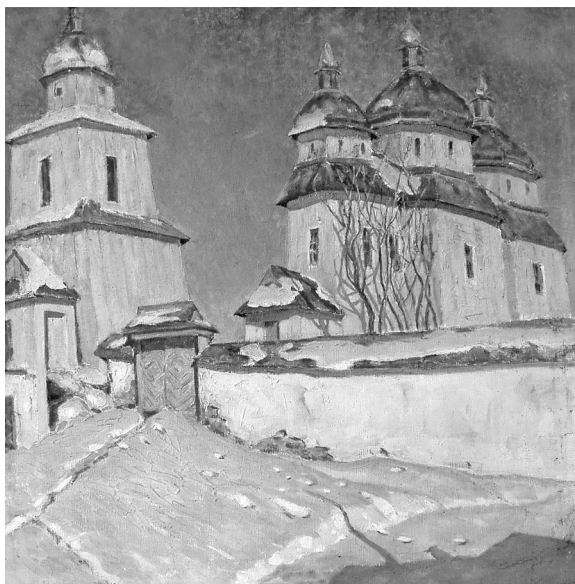
Старовинна дерев'яна церква.