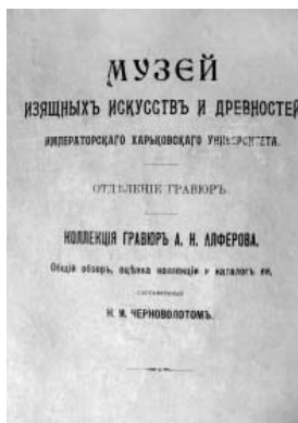
Каталог 1877 року