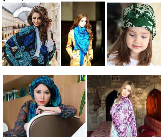
Рис. 4. Использование келагаи в современном костюме

Другим направлением стала разработка нетрадиционных вариантов ношения келагаи, предложенные дизайнером Илаой Зейналовой (рис. 4).