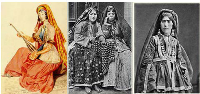
Рис. 1. Национальный женский костюм Азербайджана XIX-XX вв.

В работе поставлены задачи исследования особенностей дизайна, изучены структуры и строения келагаи на основе параметров строения ткани, как одного из элементов национального азербайджанского костюма, с целью сохранения национальных традиций и их применения в современной одежде.