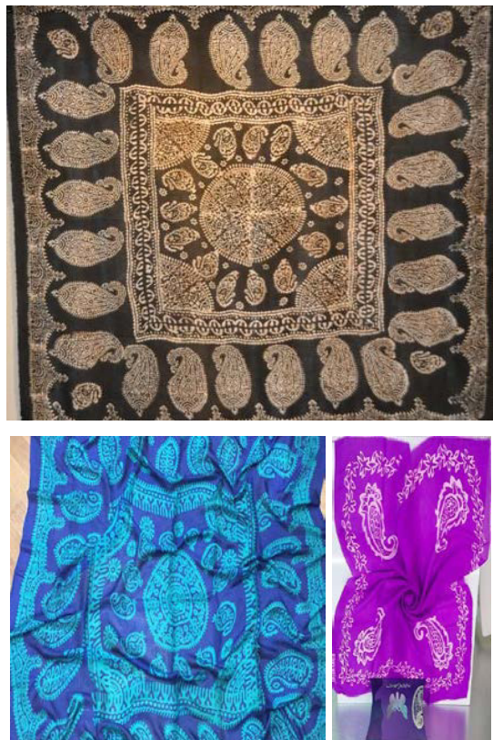
Рис. 2. Образцы платков келагаи

расположение основных и уточных нитей, связь и взаимодействие их между собой. Для получения требуемых свойств келагаи необходимо, чтобы нити в нем имели определенное расположение, и силы воздействия, которые состоят главным образом из сил трения и сил сцепления нитей.