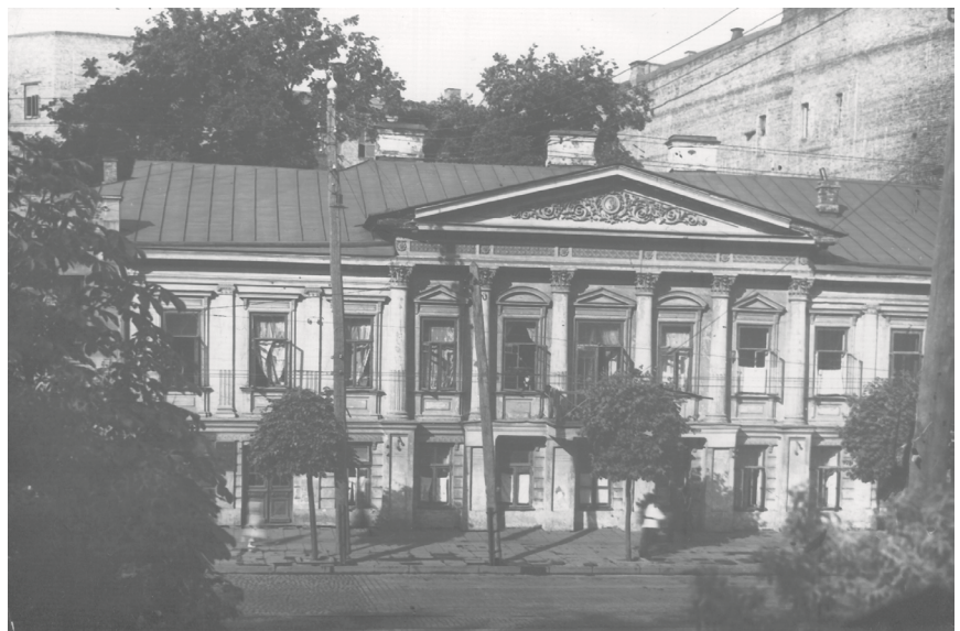
Будинок В. Гербеля. Фото середини 1930-х рр.

Наприкінці 1837 року будинок генерал-лейтенанта Гербеля винайняла адміністрація Університету св. Володимира для розташування незаможних студентів. Окрім мурованого двоповерхового будинку винаймалися дерев'яний флігель та служби, які знаходилися на території садиби. Плата за оренду приміщень становила