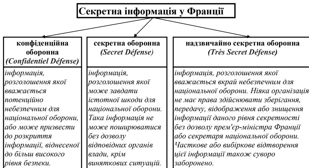
Рис. 1. Класифікація секретної інформації у Франції