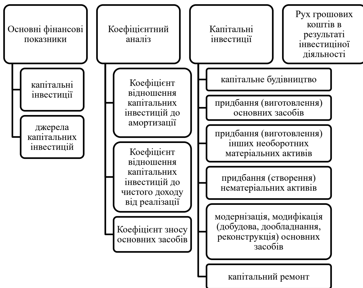
Рис. 1. Систематизація вихідних даних для проведення аналізу реальних капітальних інвестицій у фінансових звітах підприємства

Структура балансу стивідорних компаній є «важкою» завдяки питомій ваги необоротних активів у розмірі 65–80%. Вантажопереробка та обслуговування транспортних суден стивідорних компаній забезпечуються наявними основними засобами у вигляді портальних кранів та портового