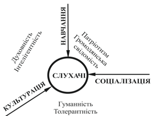
Рис. 1. Сучасний учбовий процес: фрагмент глобального інформаційного простору в трьох осях

Під соціалізацією розуміють процес (а також і його результат) засвоєння й активного відтворення індивідом соціокультурного досвіду (соціальних норм, цінностей, зразків поведінки, ролей, установок, звичаїв, культурних традицій, колективних вистав, вірувань і т.д.). У результаті соціалізації людина засвоює систему цінностей суспільства і це дозволяє їй успішно функціонувати в якості члена цього суспільства.