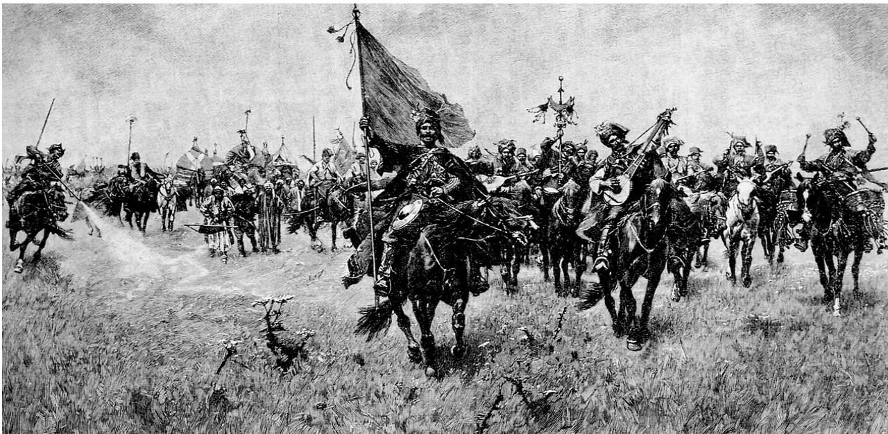
Пісня перемоги. Гравюра з картини Юзефа Брандта. 1870-ті рр.

більші з них (вони ще називались «набатами») било одразу вісім козаків. Набати здебільшого зберігали в Січі, а в походи кожний військовий загін брав малі тулумбаси, які довбиші прив'язували до сидел своїх коней. Траплялося й так, що набати, тулумбаси, барабани та бубни використовували для своєрідної психічної атаки: гучні, як гарматні постріли, звуки набату разом з гуркотом тулумбасів та пронизливим лускотом барабанів і бубнів викликали у ворожому війську паніку й примушували до втечі.