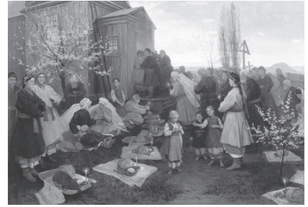
Фото 14. М. Пимоненко. «Великодня утрєня». 1891 р.

ла велику популярність його творів в Україні.