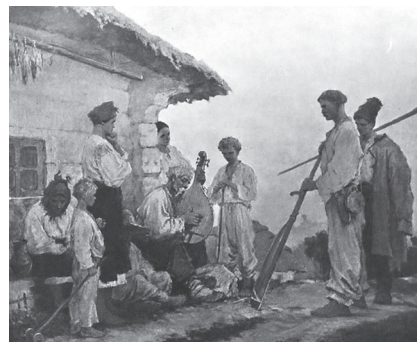
Фото 13. М. Дерезуг, «Малий Тарас слушає кобзаря». 1957

Спорідненість музичної мови композитора з українським народно-пісенним мистецтвом значною мірою зумови-