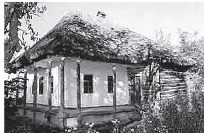
Фото 2. Хата із с. Новоохтурка Новоайдарського р-ну Луганської обл. Національний музей народної архітектури та побуту України (Музей у Пирогові)

«Етнографічні регіони України, станом на кінець XIX – початок XX ст. Терміном «етнографічний регіон» означають частину території розселення