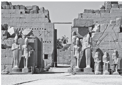
Фото 1. Луксорський Храм. Луксор. Єгипет

Метою даного підручника є не просто показати розвиток різних видів мистецтва в культурних регіонах світу, а виокремити лише ті види мистецтва, які є характерними для кожного регіону: показати їхні особливості, виділити характерні риси на конкретних прикладах творів кожного виду мистецтва.