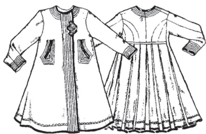
Фото 6. Юпка