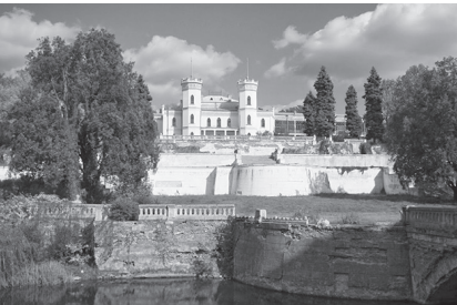
Фото 3. Шарівський палац. Сміт. Шарівка, Харківська область

Показати красу і різноманітність українського декоративно-ужиткового мистецтва, регіональні особливості народного будівництва, архітектури, декоративного та музичного мистецтва – основна задача розділу «Мистецтво європейського культурного регіону. Україна».