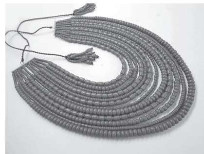
Фото 10. Коралі (коралове намисто)