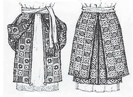
Фото 5. Пляхта

Автори свідомо поділили знайомство з архітектурою України на дві частини «Народна архітектура» та «Архітектурні пам'ятки». Знайомство з народною архітектурою – це знайомство не тільки з побутом народу, а й