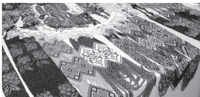
Фото 8. Гердани

Кожний етнографічний регіон України славний видатними діячами образотворчого та музичного мистецтва,