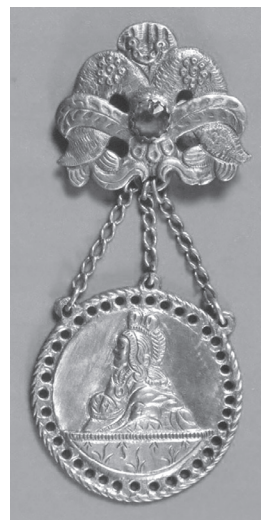
Фото 11. Дукачі. Слобожанщина

майстрами декоративно-ужиткового мистецтва. На наш погляд, їм доцільно приділити окремий урок, на якому прослухати уривки музичних творів, передивитись та проаналізувати роботи художників.