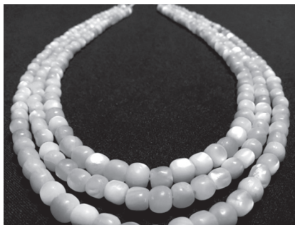
Фото 10. Баламути (перламутрове намисто)