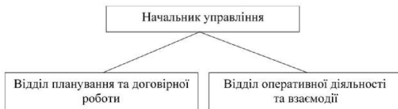
Рисунок 1 – Типова структура управління ЦВ

управління ЦВС Об'єднаного командування ЗС НАТО «Брюнссум» включає два відділи (див. рис. 1, розглянуто в [3, с. 15]).