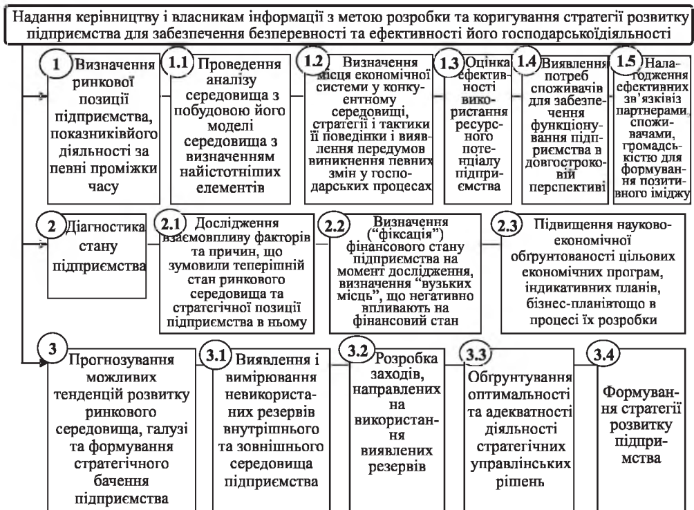
Рис. 2. “Дерево завдань” стратегічного аналізу діяльності суб’єкта господарювання: фрагментарний розріз

У відповідності до теорії менеджменту “дерево цілей” є одним із засобів, що використовуються для обґрунтування нових рішень про вибір чи коригування потужності операційної системи, а також для розв’язання широкого ряду інших проблем управління операційною системою [7, с. 315]. Використання “дерева завдань” в стратегічному аналізі обґрунтовується тим, що за його допомогою визначаються всі можливі альтернативи стратегічних рішень та ураховуються всі внутрішні та зовнішні фактори і причини, що зумовили позитивні та негативні зміни у діяльності суб’єкта господарювання.