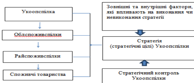
Рисунок 1 – Місце стратегічного контролю в системі управління підприємствами та організаціями споживчої кооперації України

який здійснює оперативний контроль та аудитор, який здійснює стратегічний контроль)), внести зміни до установчих документів). Створити методичну базу (затвердити Положення, Інструкції, розробити робочі документи аудитора з стратегічного контролю, визначити методи, які найбільш ефективні при здійсненні цього виду внутрішнього контролю).