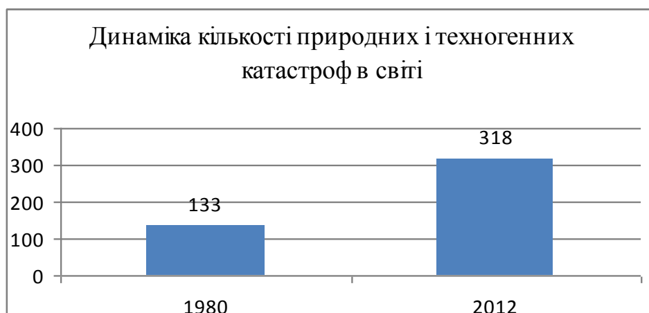
Рис. 1. Динаміка кількості природних та техногенних катастроф у світі

Хоч якого розвитку набуло страхування в світі, проте кількість стихійних лих, хвороб, нещасних випадків, і, насамперед, масштабність збитків, зростає значно більшими темпами [5]. Постають і набувають великого розмаху природні і техногенні ризики, які висувують ряд запитань для науки – від причин їх виникнення до способів управління.